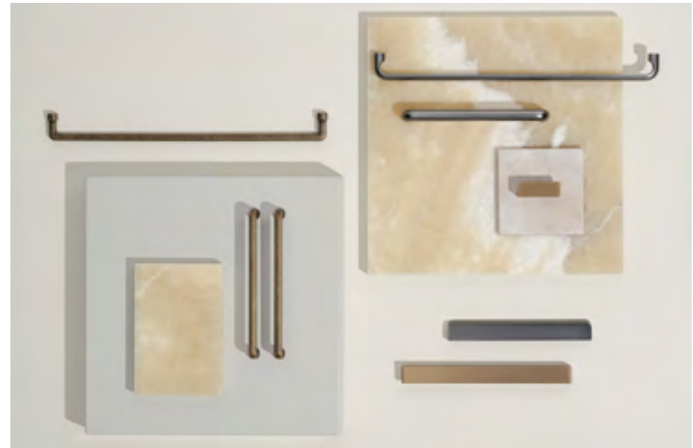
Elan, Equester & Guild | Disegnata: Kamper Form & VE2 | Indice: 89 & 90