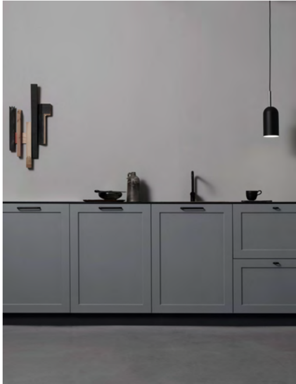
D-lite | Disegnata: Adam Laws | Indice: 89