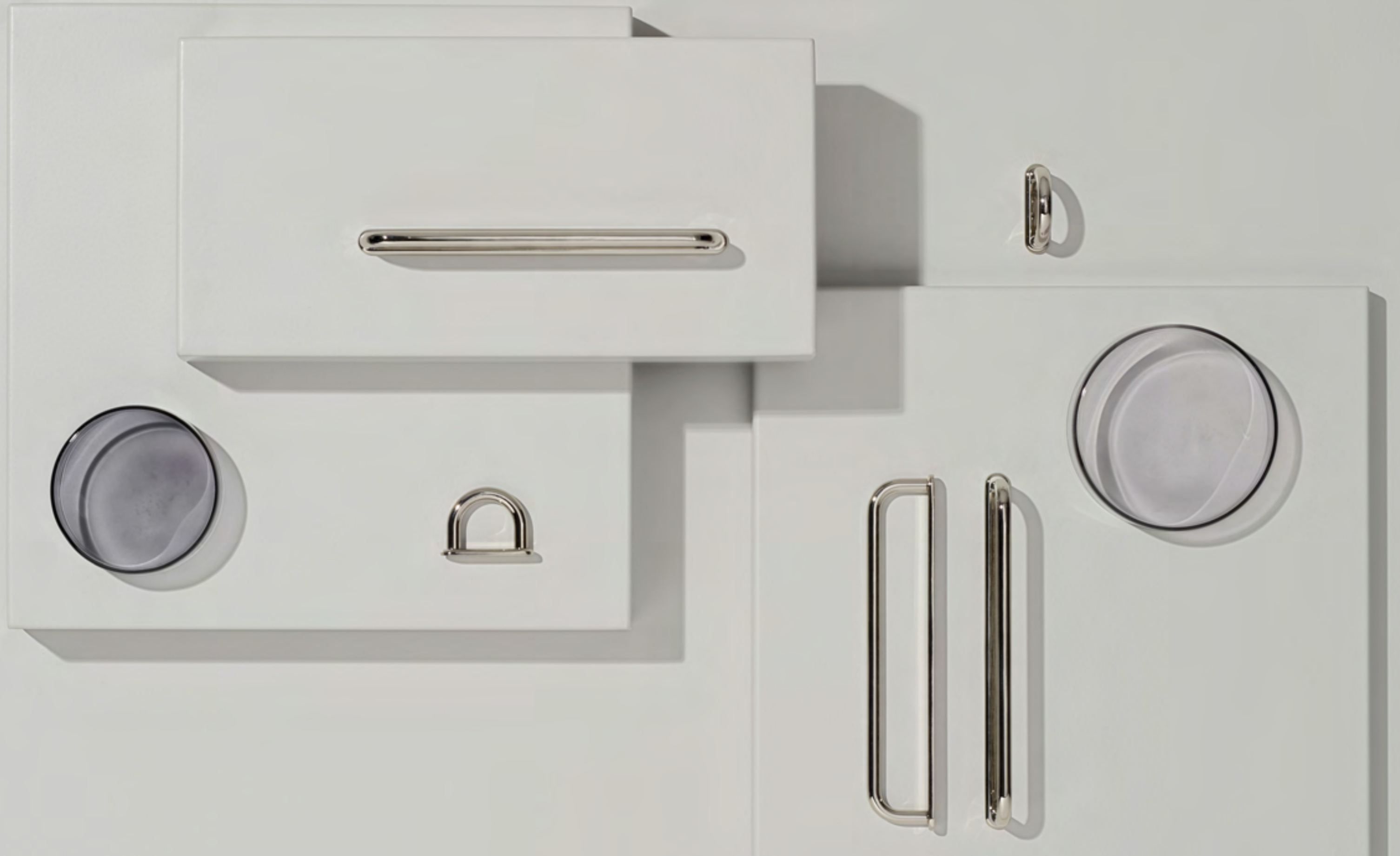
D-lite | Disegnata: Adam Laws | Indice: 89