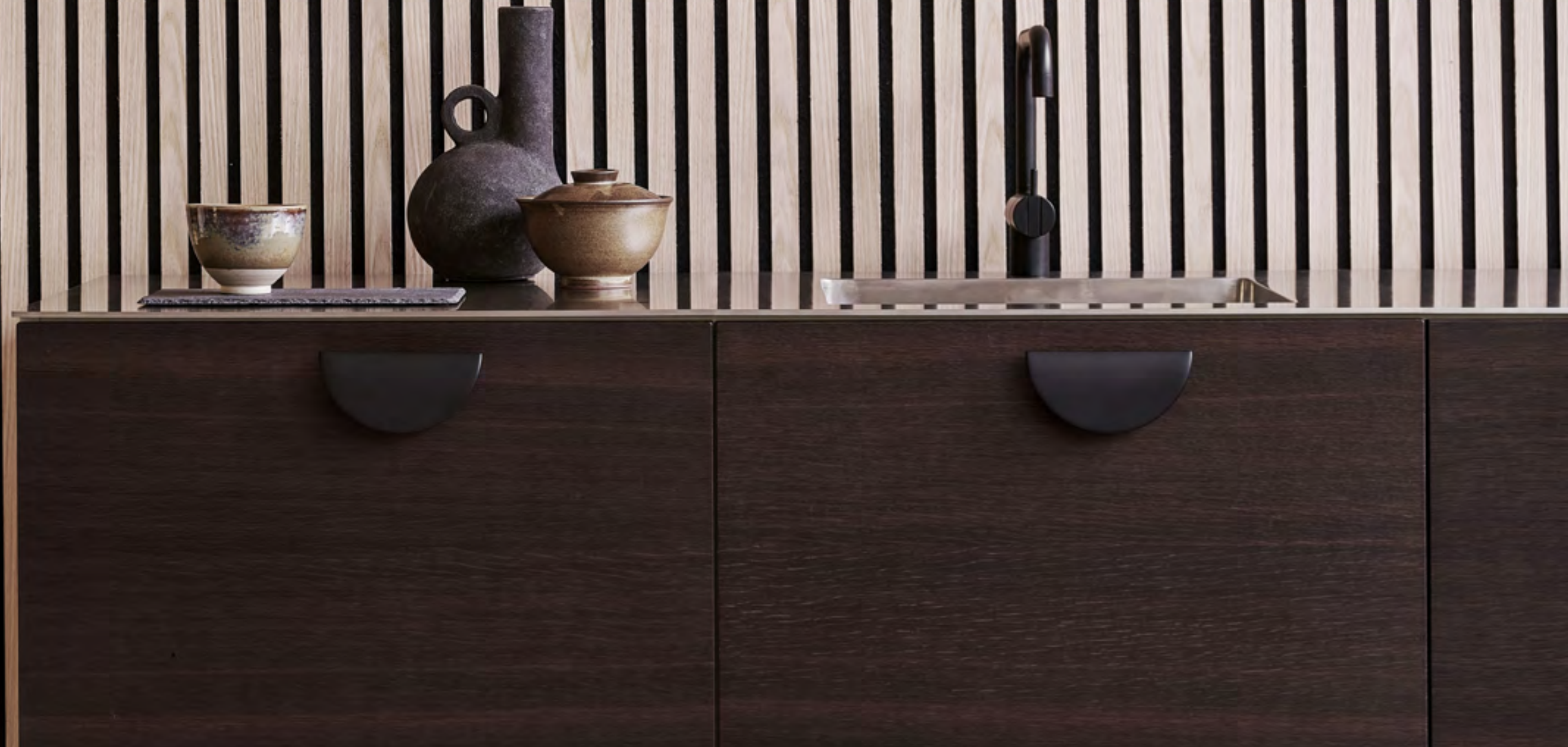
Horizon Large | Disegnata: Adam Laws | Indice: 91