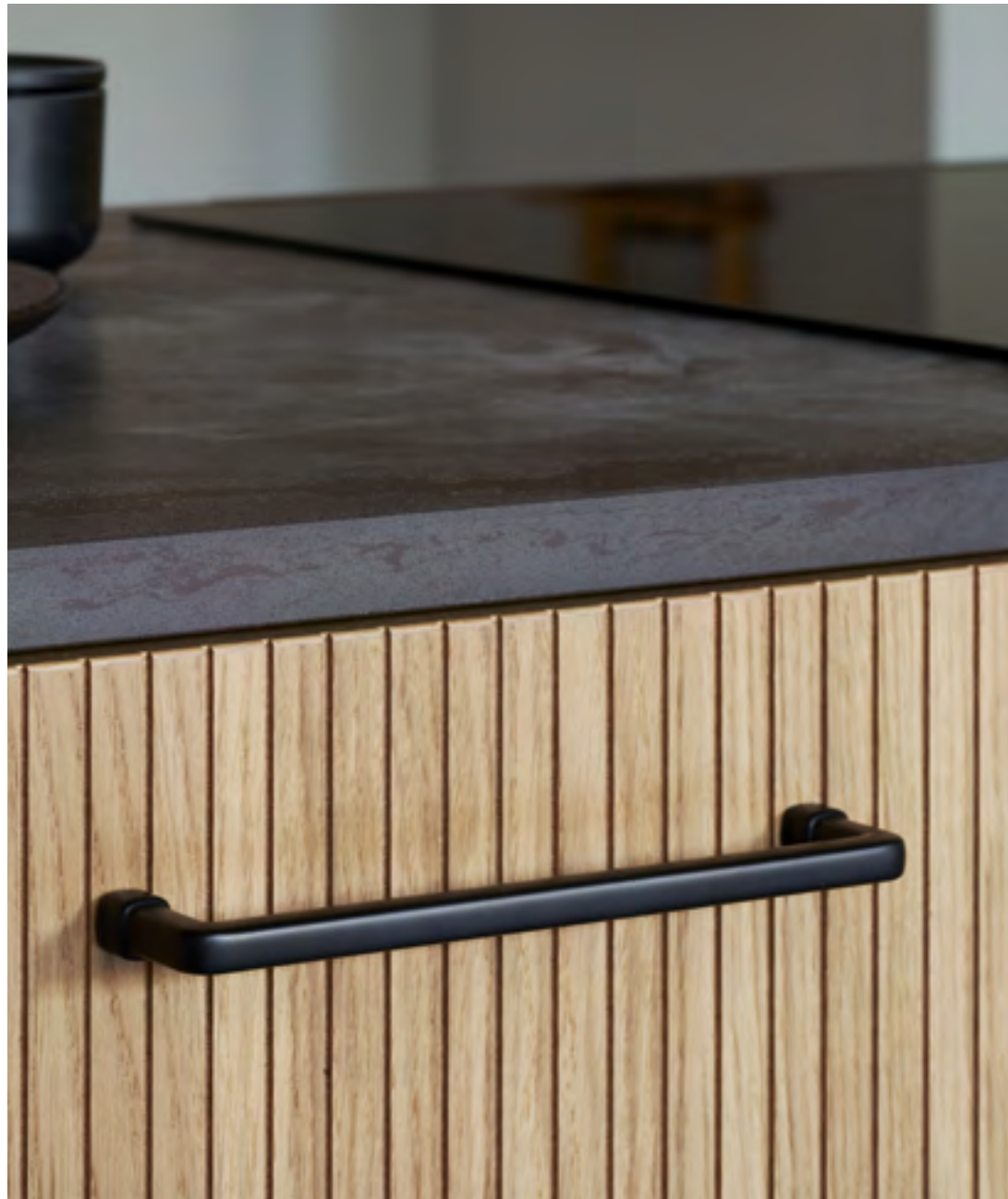
Equester | Disegnata: Kamper Form | Indice: 90

I piedini e la base sia di Equester che di Equester Cup presentano una forma che ricorda la testa dei chiodi usati per ferrare i cavalli: un piccolo dettaglio che ne sottolinea in ogni caso il design. La famiglia Equester ha la giusta misura di ornamenti senza essere troppo elaborata.