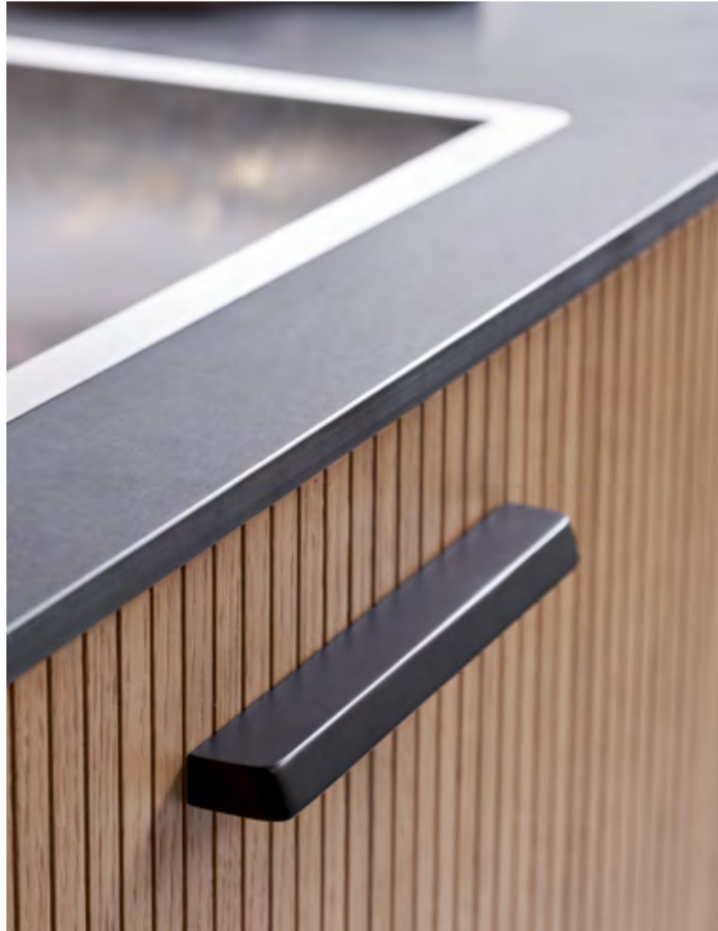
Guild | Disegnata: VE2 | Indice: 90