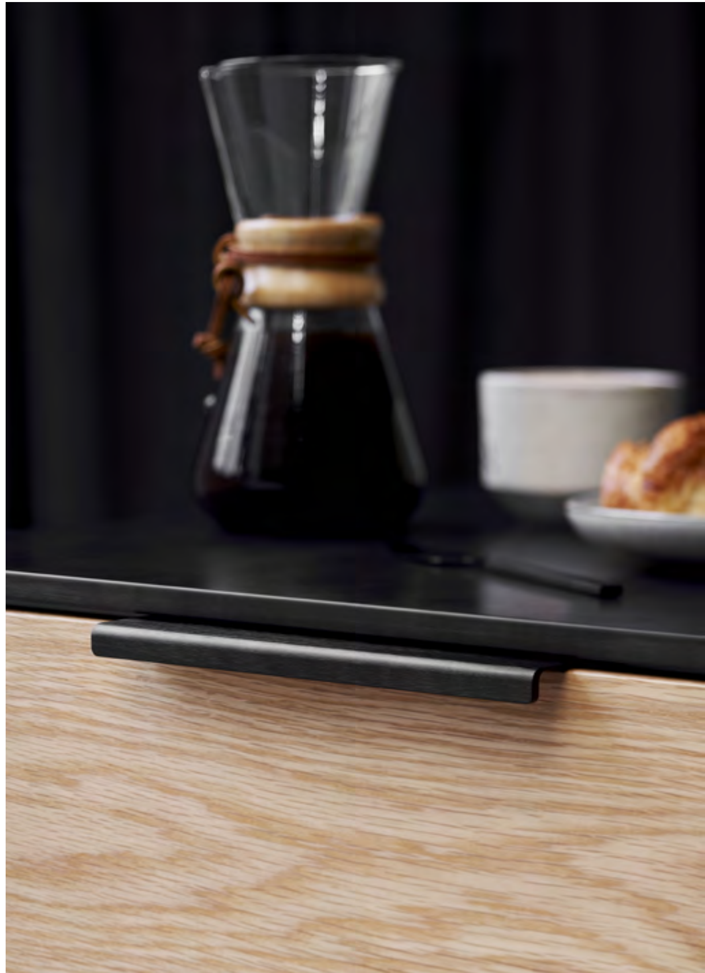
Artisan | Disegnata: VE2 | Indice: 88