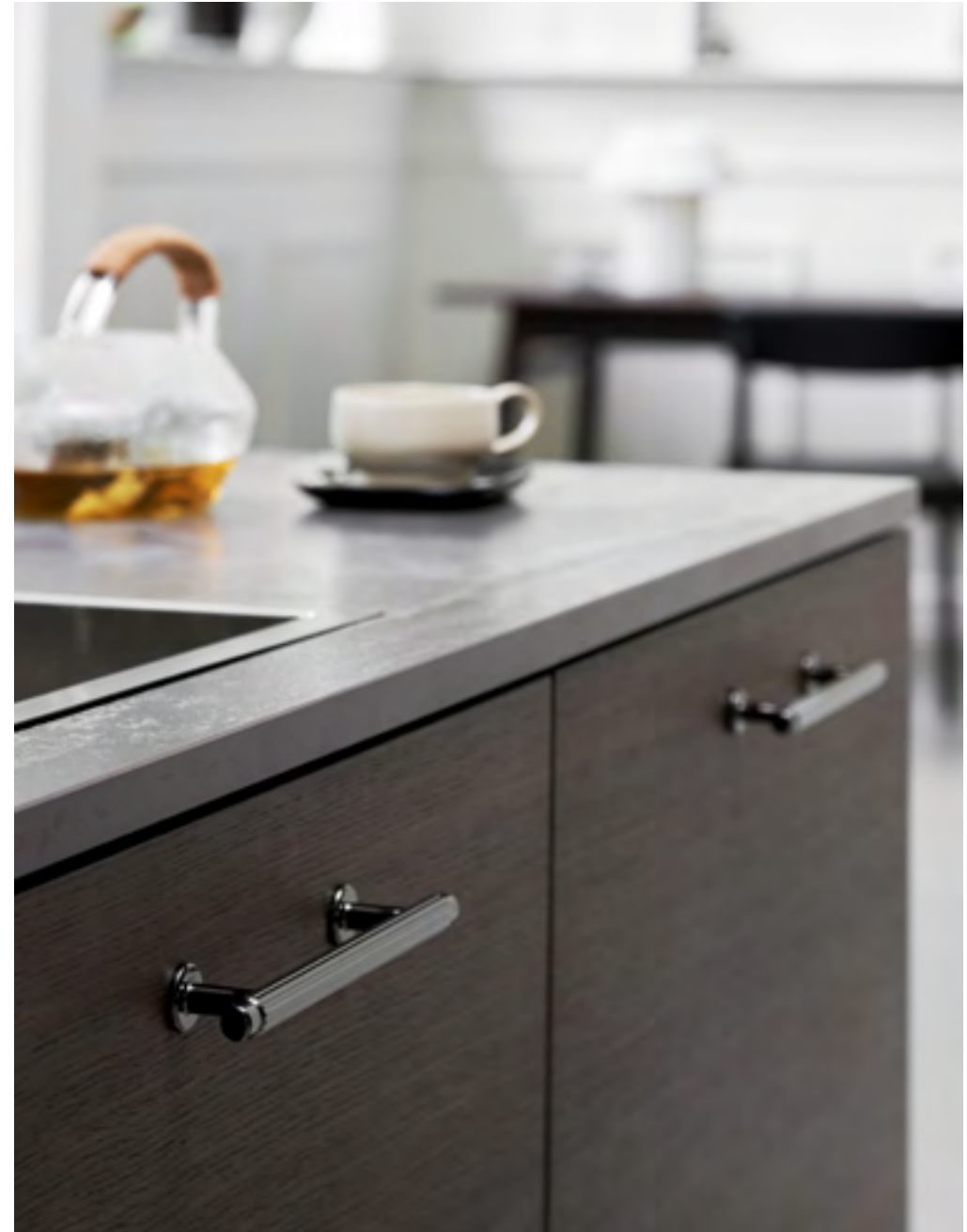
Villa | Disegnata: Kamper Form | Indice: 93