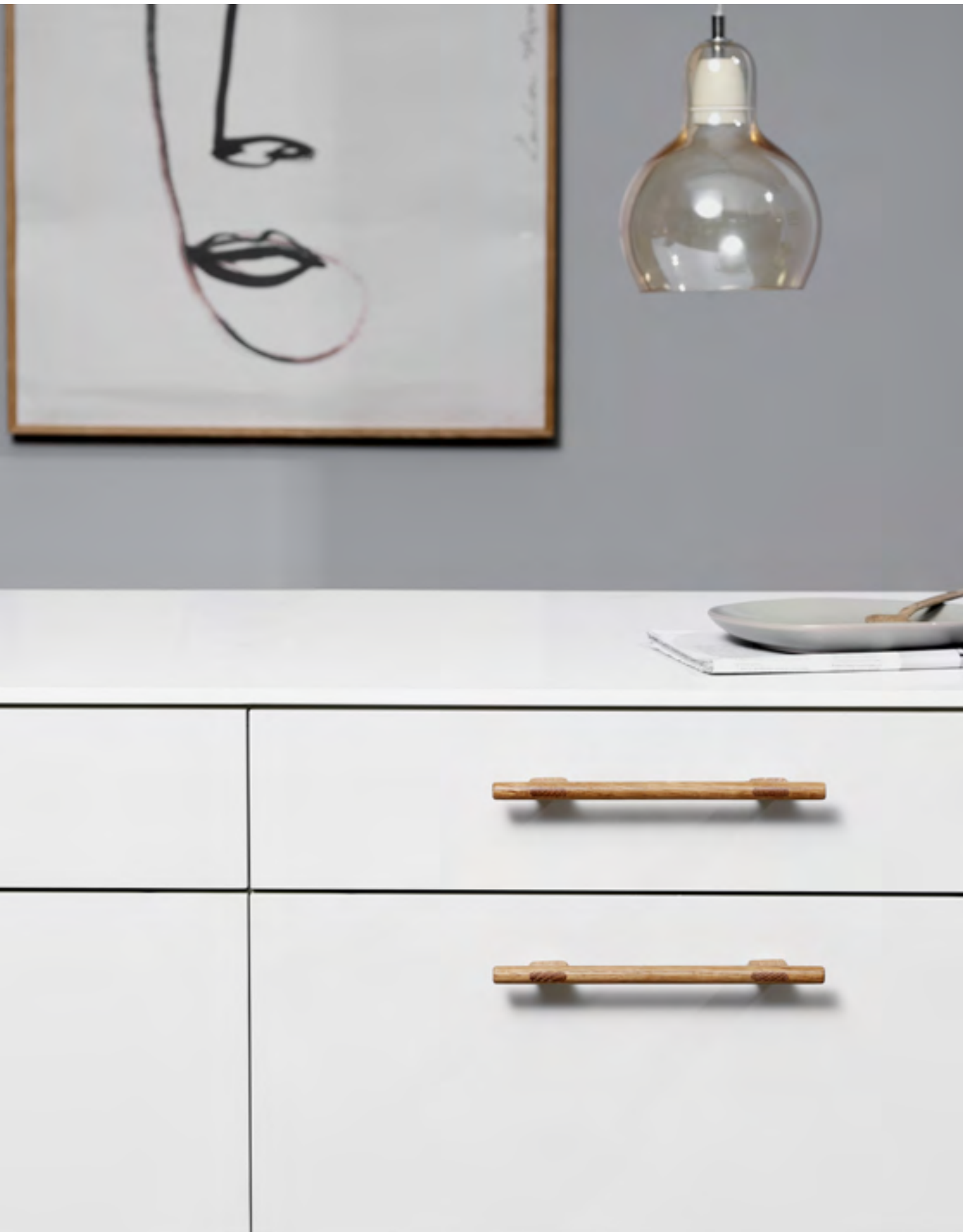
Join | Disegnata: kaschkasch | Indice: 91