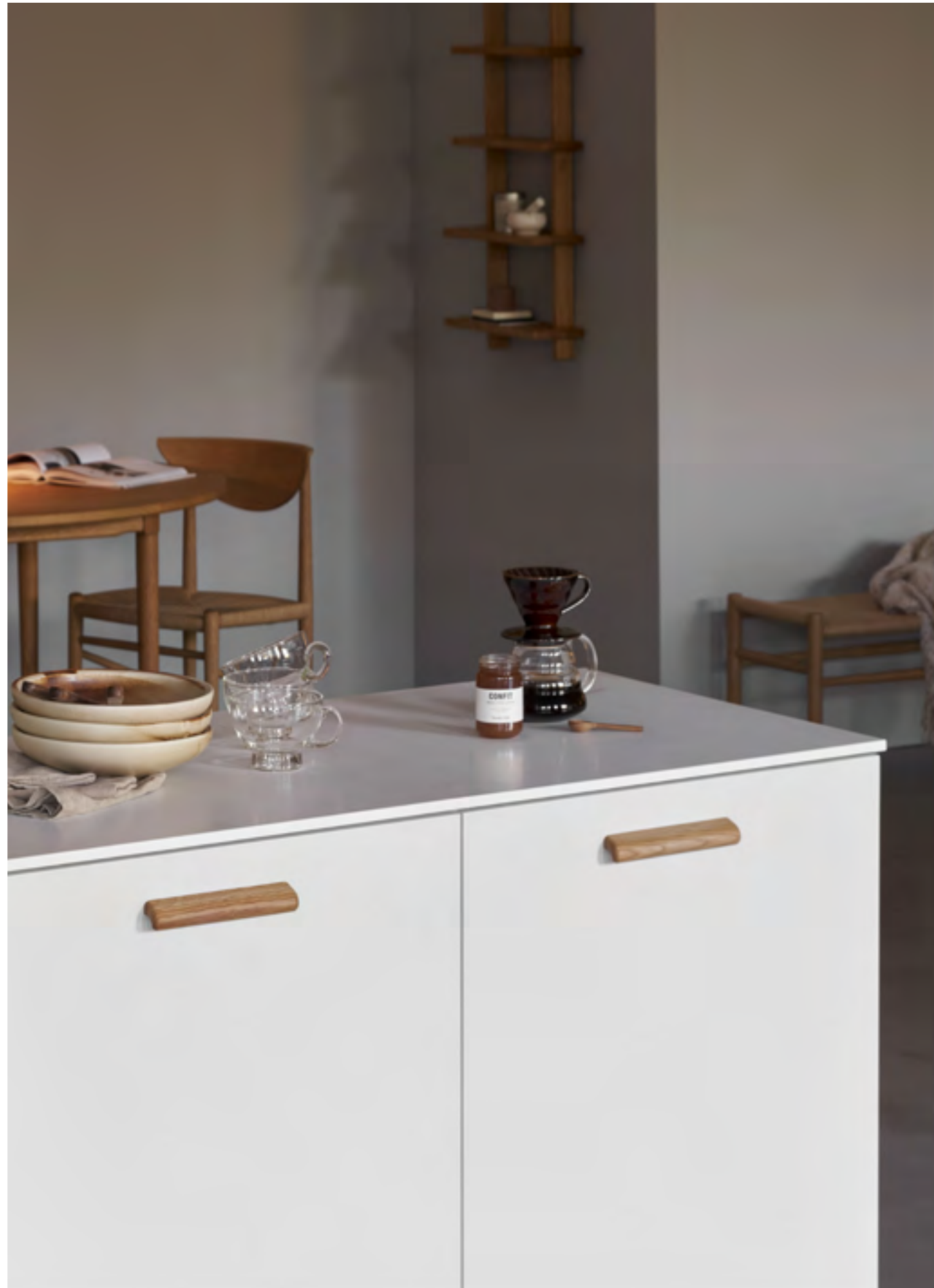
Glove | Disegnata: kaschkasch | Indice: 90