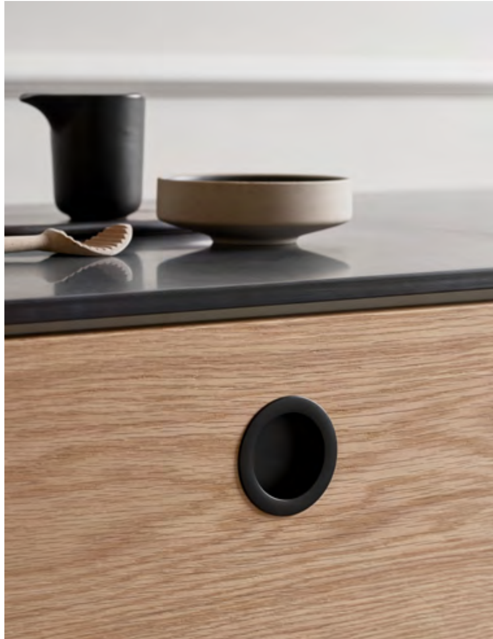
Tub Round | Disegnata: Adam Laws | Indice: 92