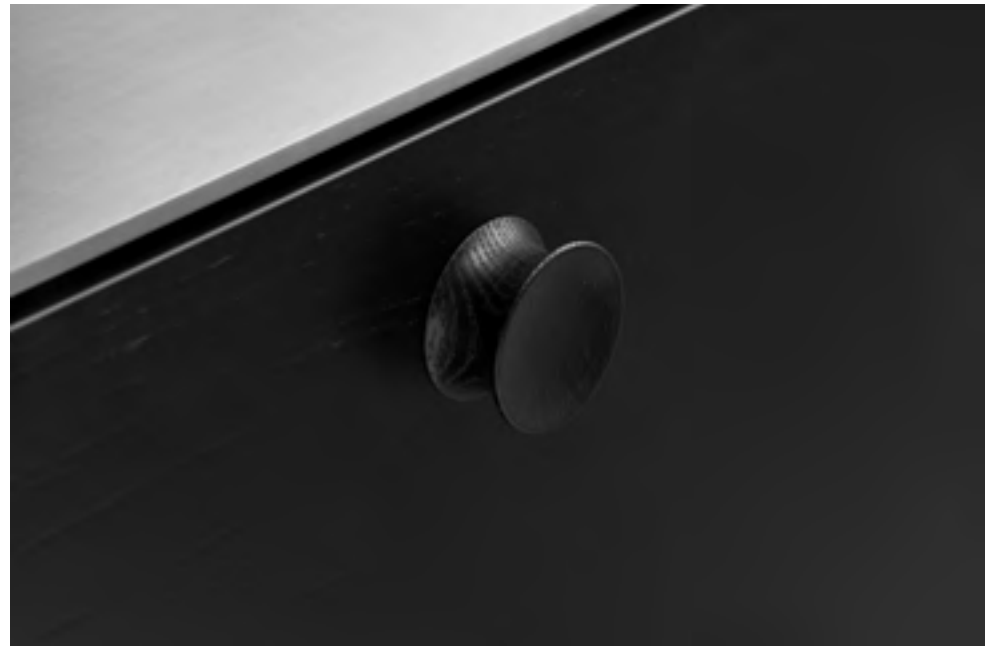
Pulley | Disegnata: kaschkasch | Indice: 92