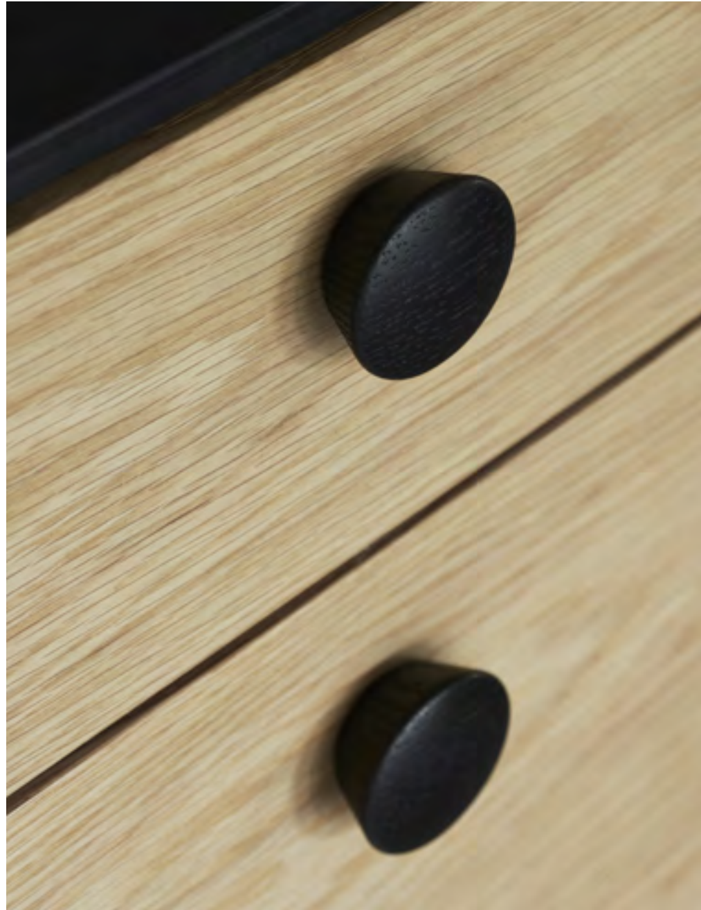
Beret | Disegnata: kaschkasch | Indice: 88