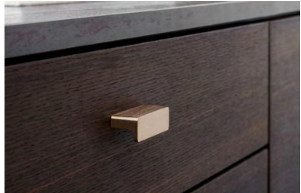
Elan | Disegnata: VE2 | Indice: 89