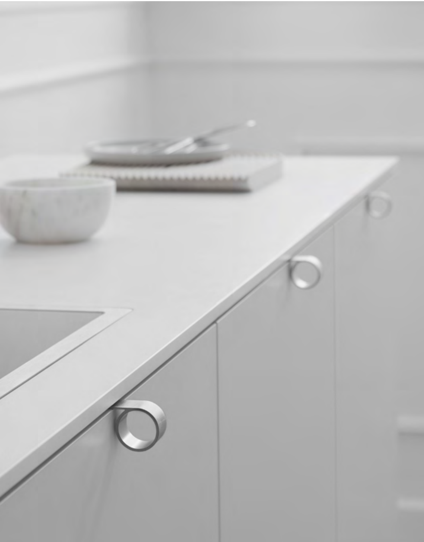
Tug | Disegnata: Steffensen & Würtz | Indice: 93