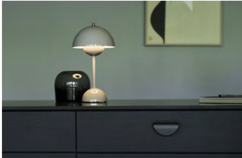
Horizon Small | Disegnata: Adam Laws | Indice: 91