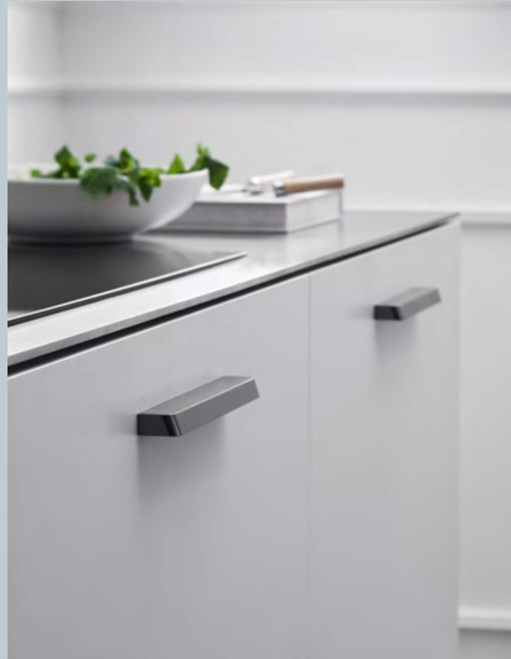
Guild | Disegnata: VE2 | Indice: 90