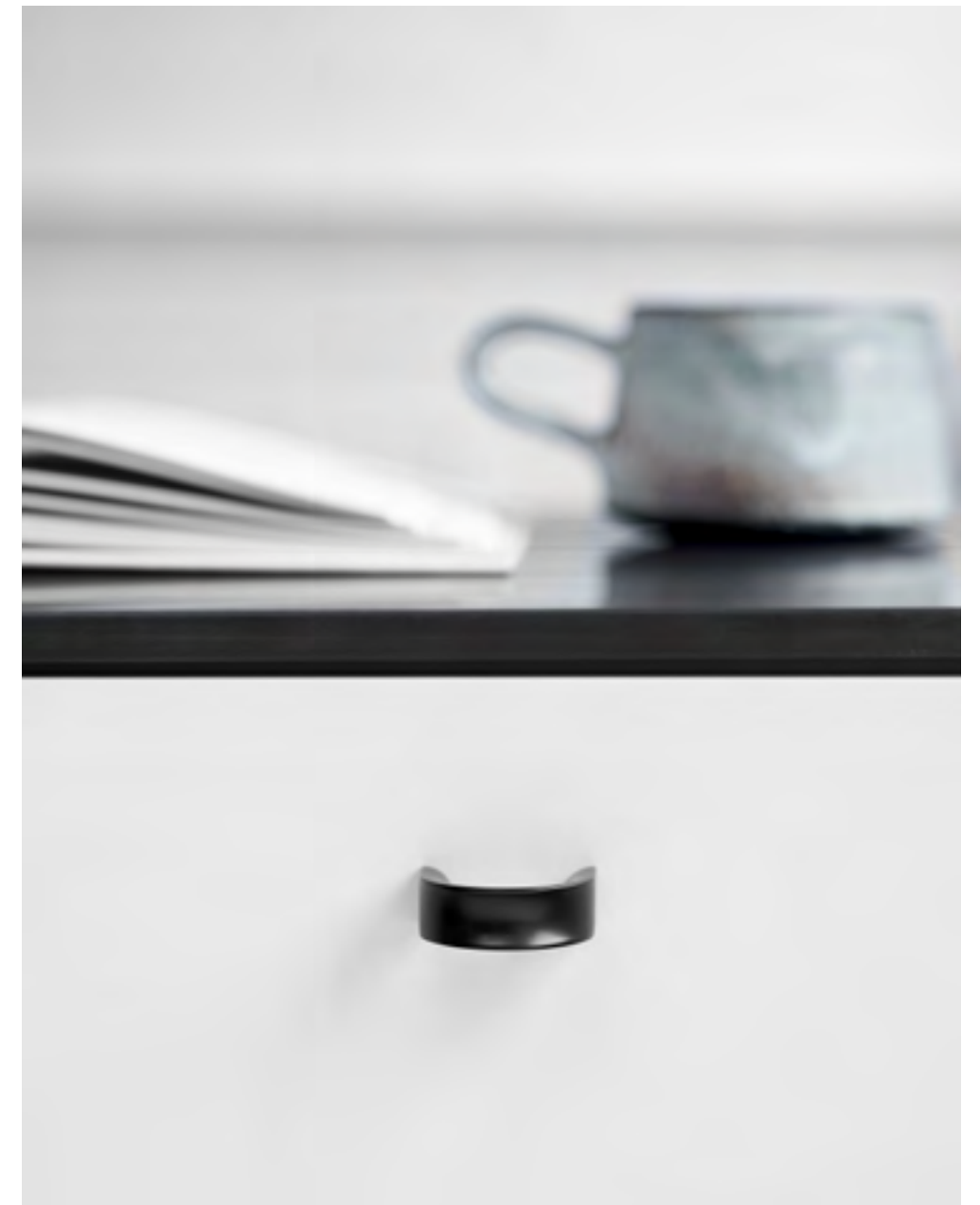
Inside | Disegnata: kaschkasch | Indice: 91

Inside è l'unica maniglia in metallo di kaschkasch all'interno di questa collezione. A prima vista la si definirebbe una classica maniglia a D, ma a un esame più attento rivela un design incredibilmente tattile che fa uso di forme geometriche concave e convesse contrapposte.