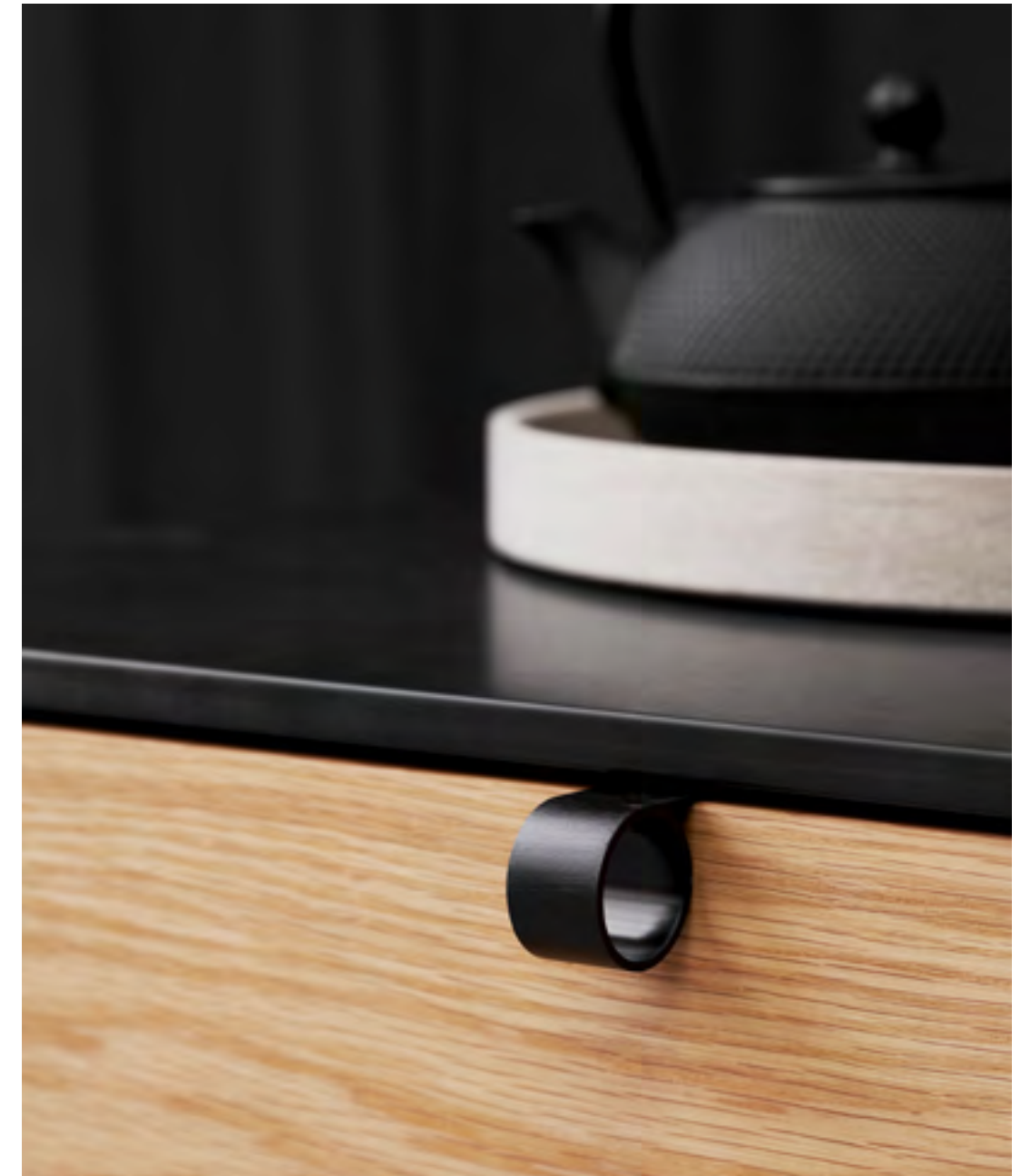
Tug | Disegnata: Steffensen & Würtz | Indice: 93

Tug è una delle quattro nuove maniglie in alluminio certificato Cradle to Cradle della news collection 2022/ by furnipart. Tug aggiungerà un tocco interessante a qualsiasi frontale, e la scelta tra aspetto inox o nero offre al designer la possibilità di scegliere tra un approccio discreto o di maggiore espressività.