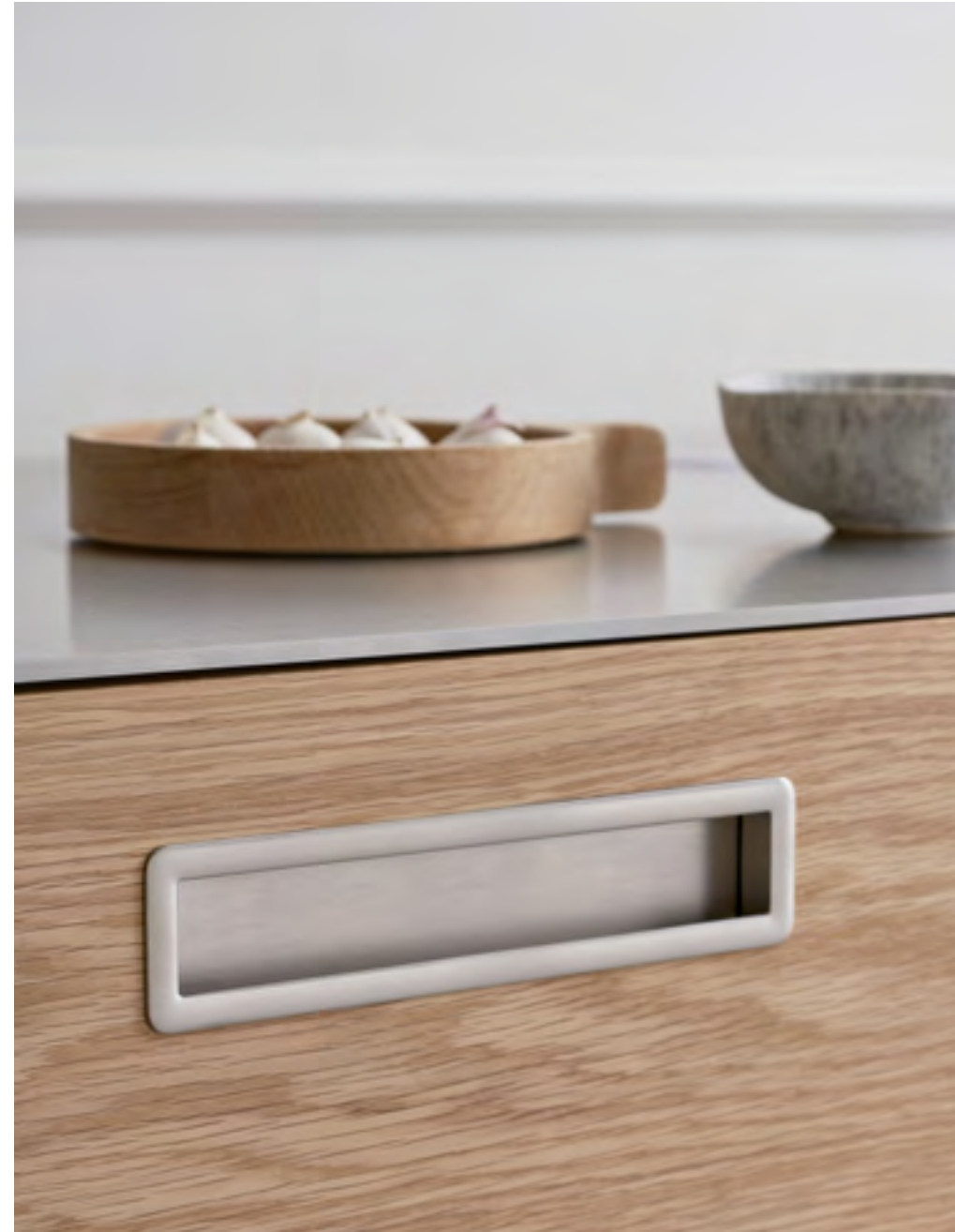
Tub Straight | Disegnata: Adam Laws | Indice: 92