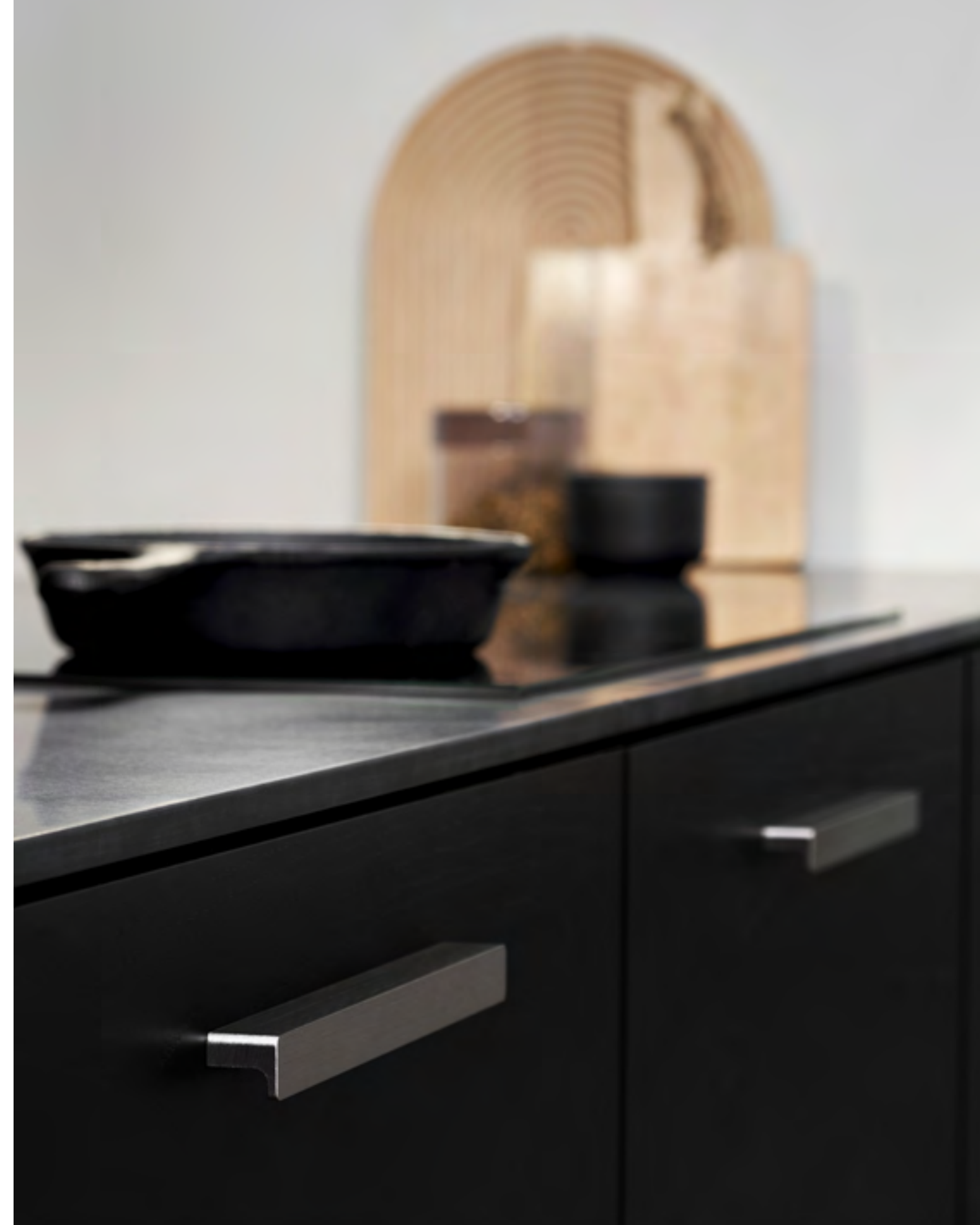
Elan | Disegnata: VE2 | Indice: 89

Sia in Guild che in Elan la pulizia delle linee si unisce a una certa morbidezza. La precisione con cui vengono eseguiti rende gli spigoli arrotondati ancora più dominanti e allo stesso tempo rende l'espressione complessiva accogliente.