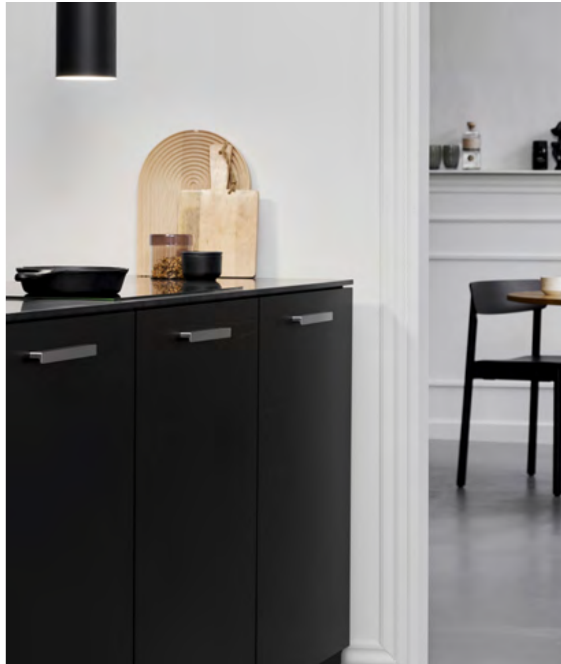
Elan | Disegnata: VE2 | Indice: 89

Sia in Guild che in Elan la pulizia delle linee si unisce a una certa morbidezza. La precisione con cui vengono eseguiti rende gli spigoli arrotondati ancora più dominanti e allo stesso tempo rende l'espressione complessiva accogliente.