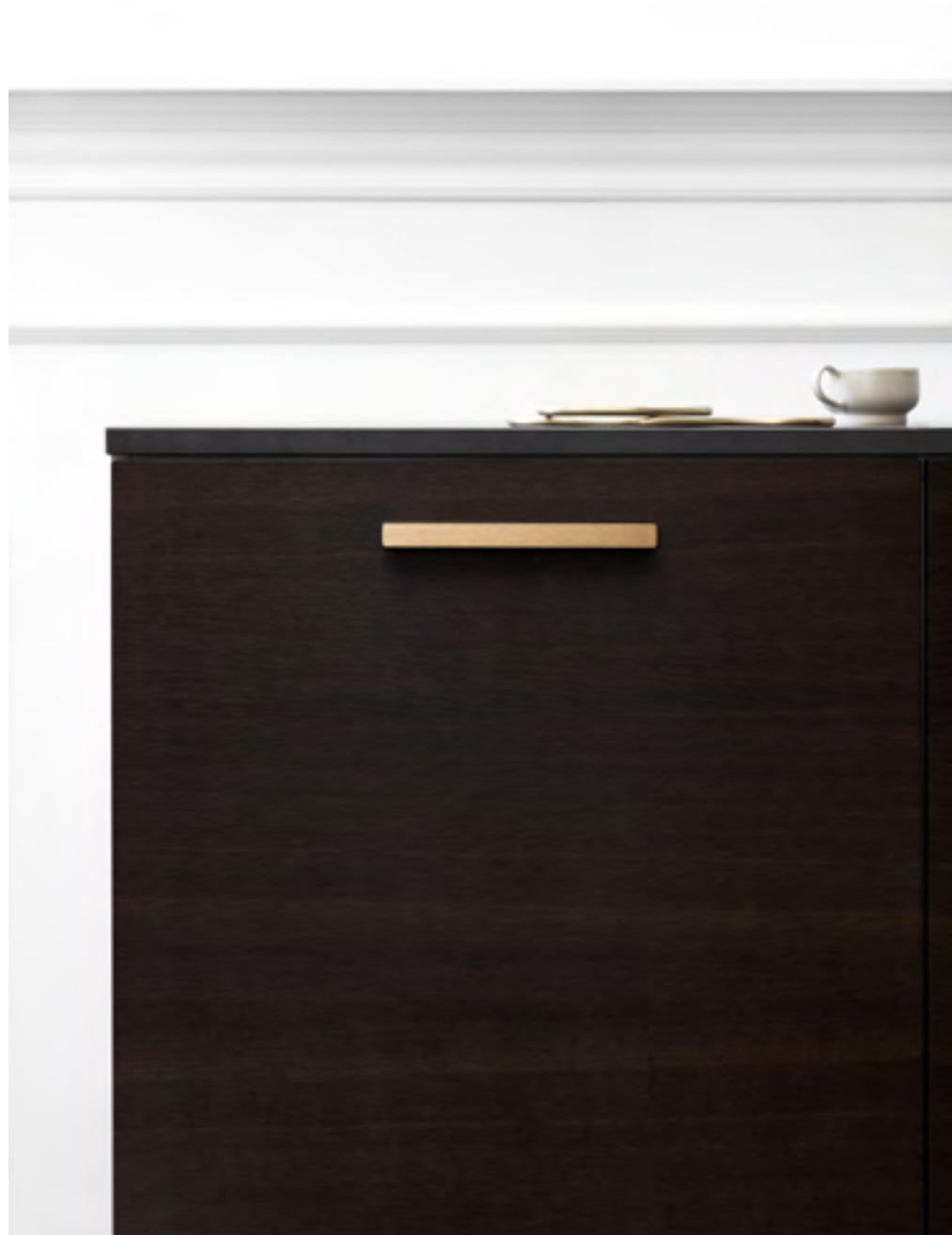
Elan | Disegnata: VE2 | Indice: 89