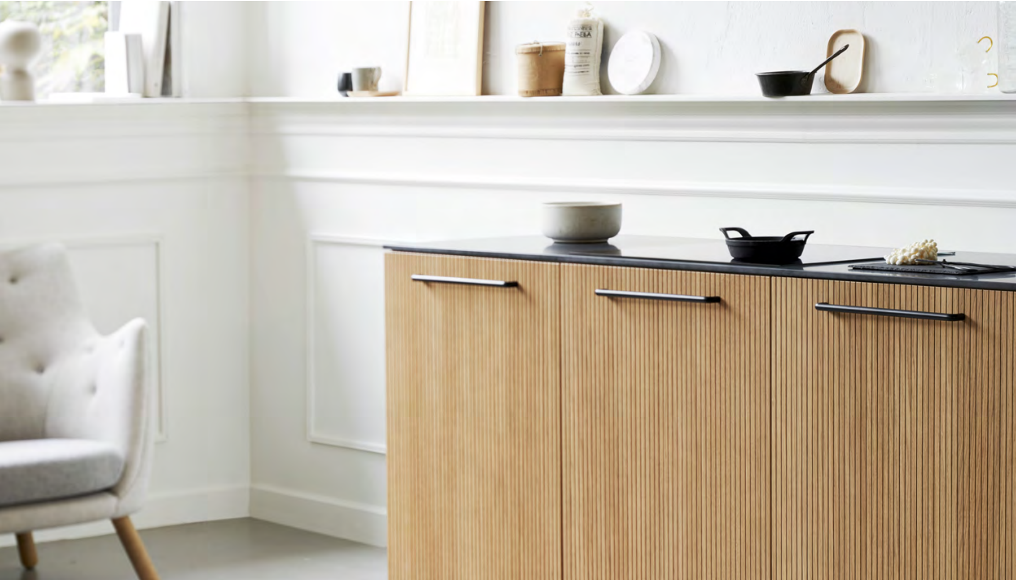
Carve | Disegnata: Kamper Form | Indice: 88