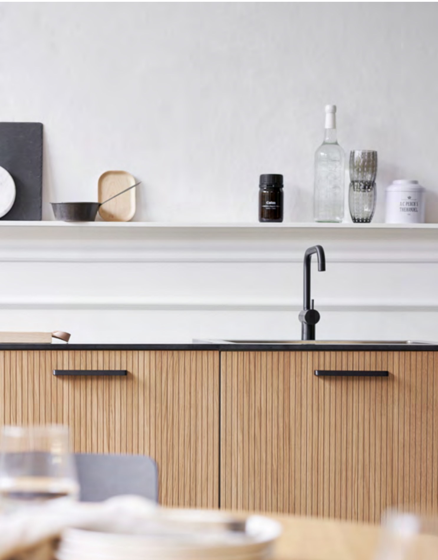
Guild | Disegnata: VE2 | Indice: 90