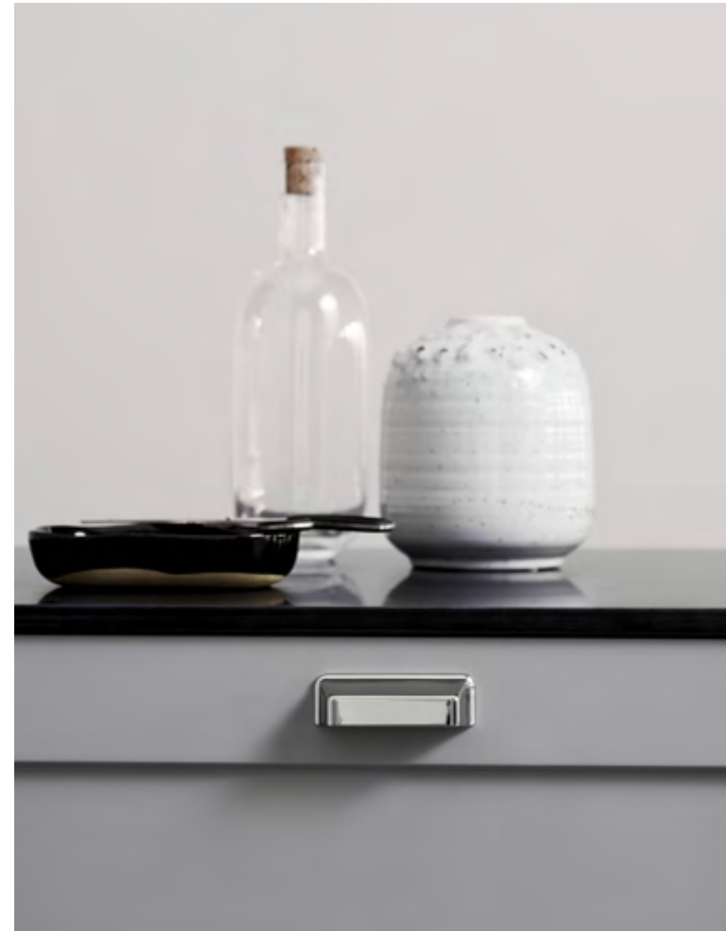
Equester Cup | Disegnata: Kamper Form | Indice: 90