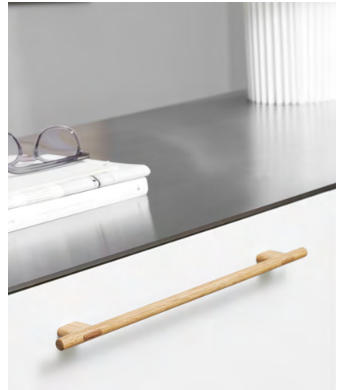
Join | Disegnata: kaschkasch | Indice: 91

Una bella giunzione di mortasa e tenone è la caratteristica principale del maniglia Join. La costruzione con mortasa e tenone è diffusa nell'industria del mobile artigianale per la sua forza, robustezza e per il suo appagante appeal estetico.