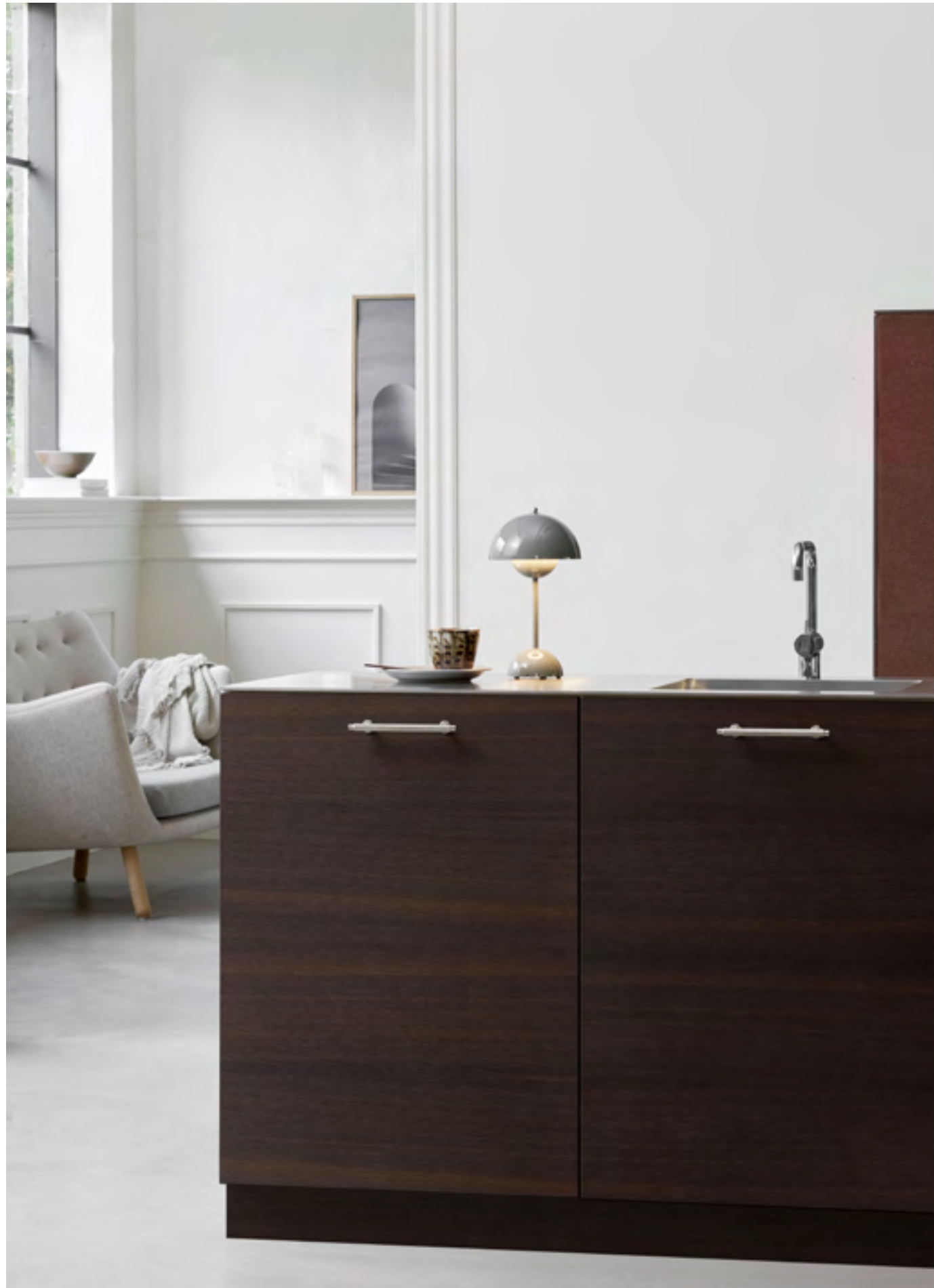
Villa | Disegnata: Kamper Form | Indice: 93