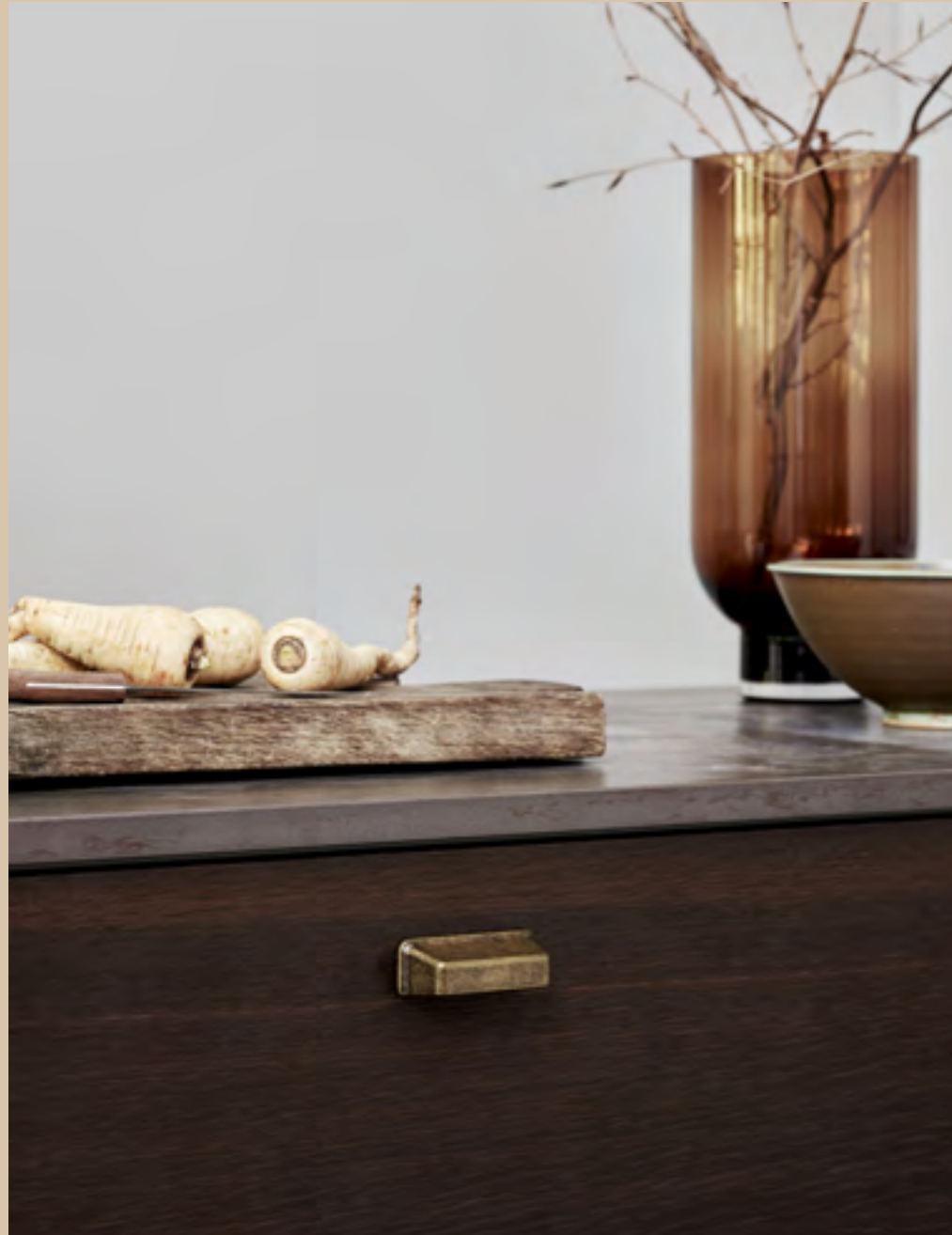
Equester Cup | Disegnata Kamper Form | Indice: 90