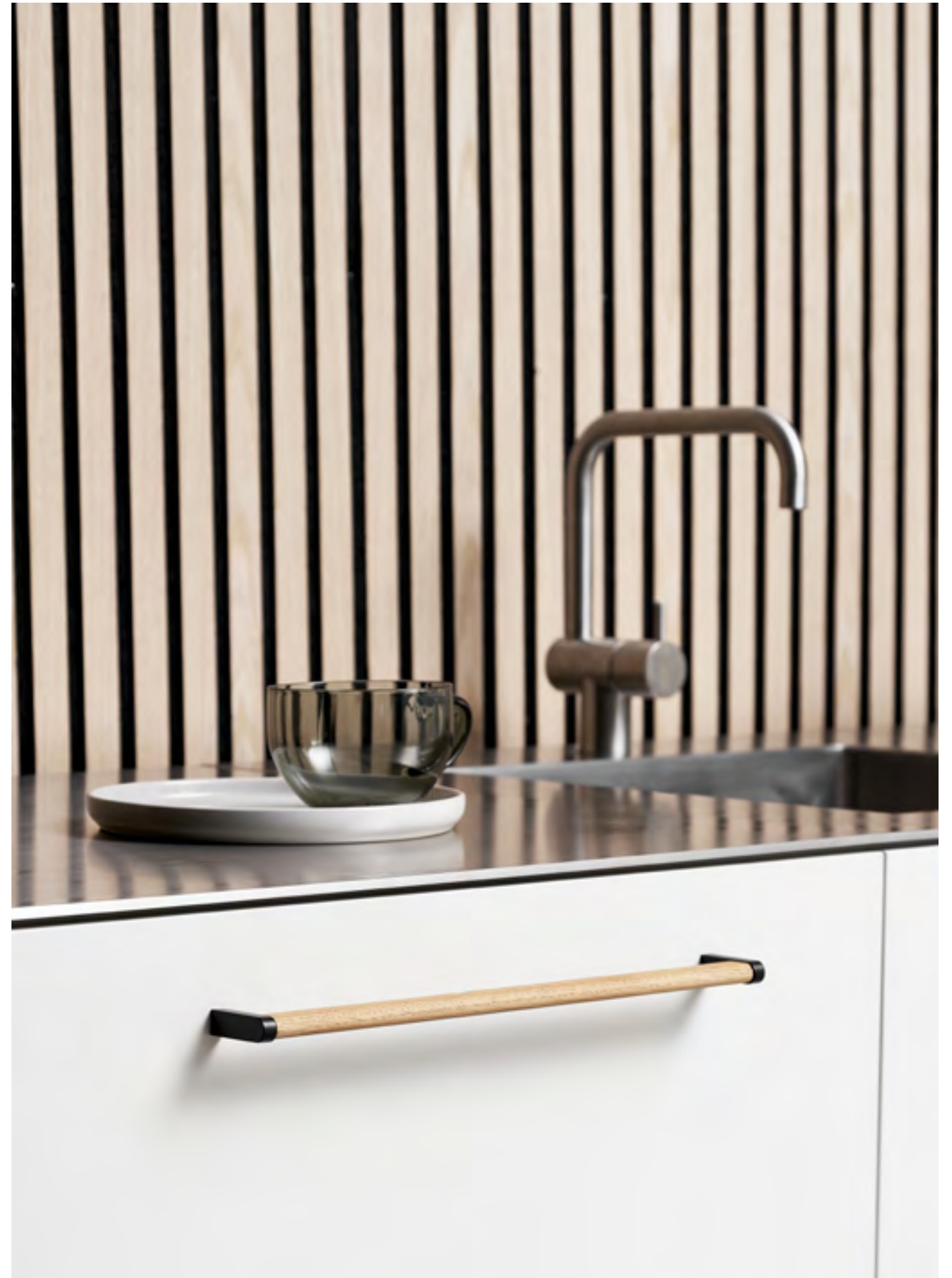
Crossing | Disegnata: kaschkasch | Indice: 89