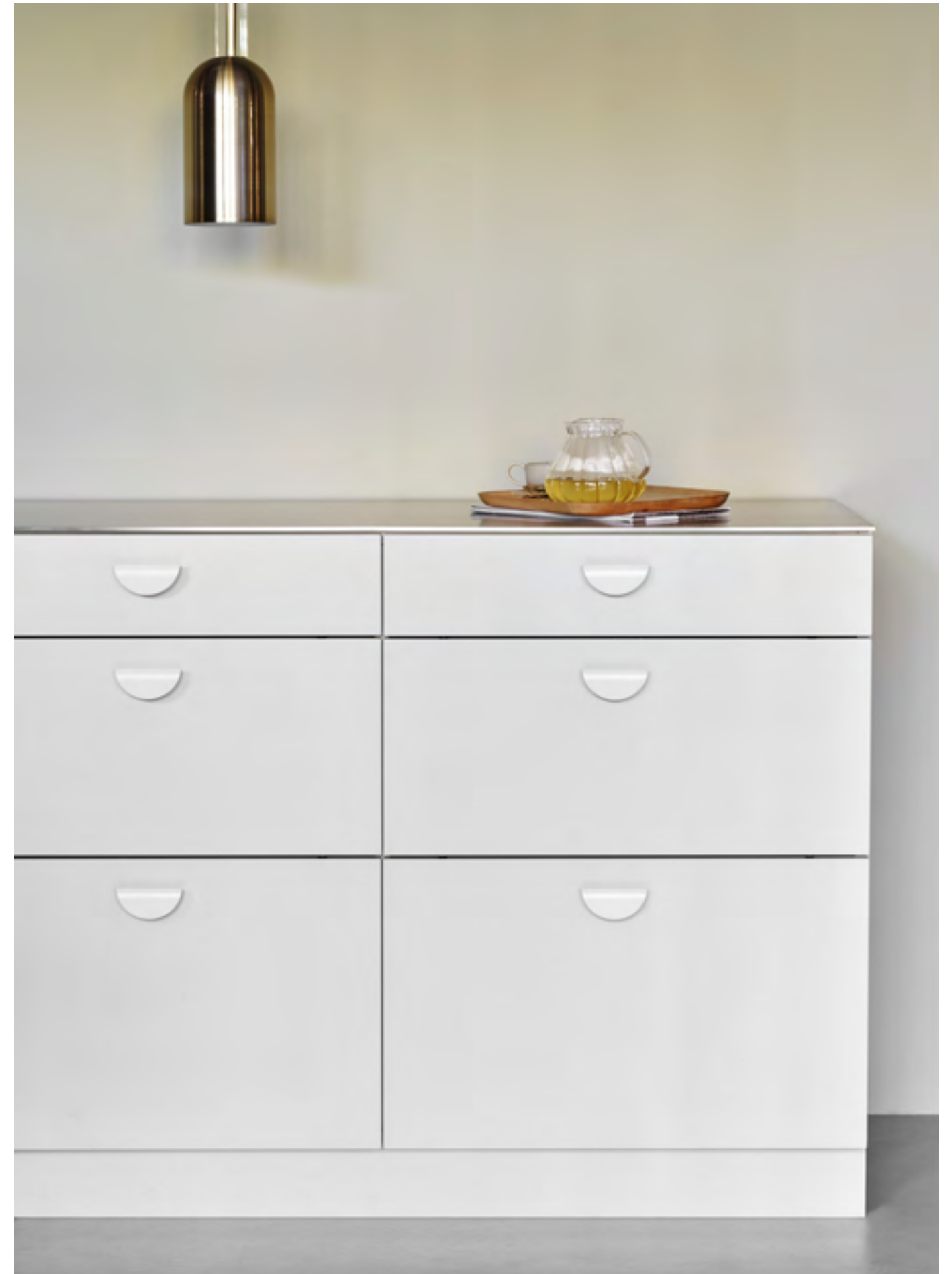
Horizon Small | Disegnata: Adam Laws | Indice: 91