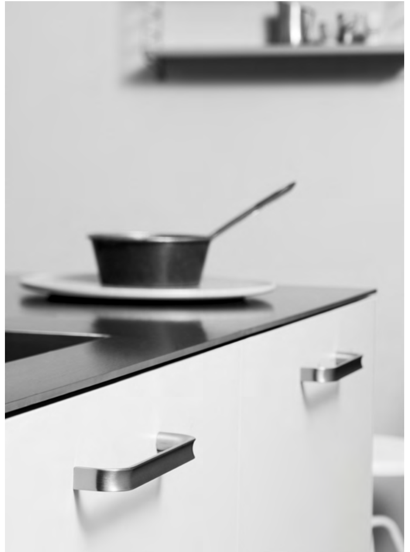
Inside | Disegnata: kaschkasch | Indice: 91