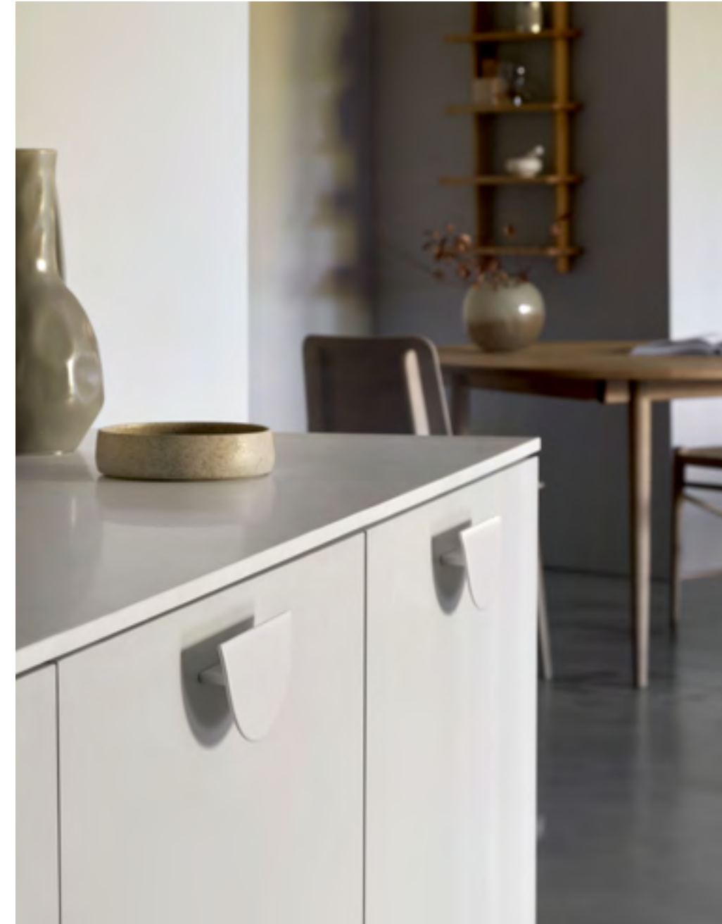
Horizon Large | Disegnata: Adam Laws | Indice: 91