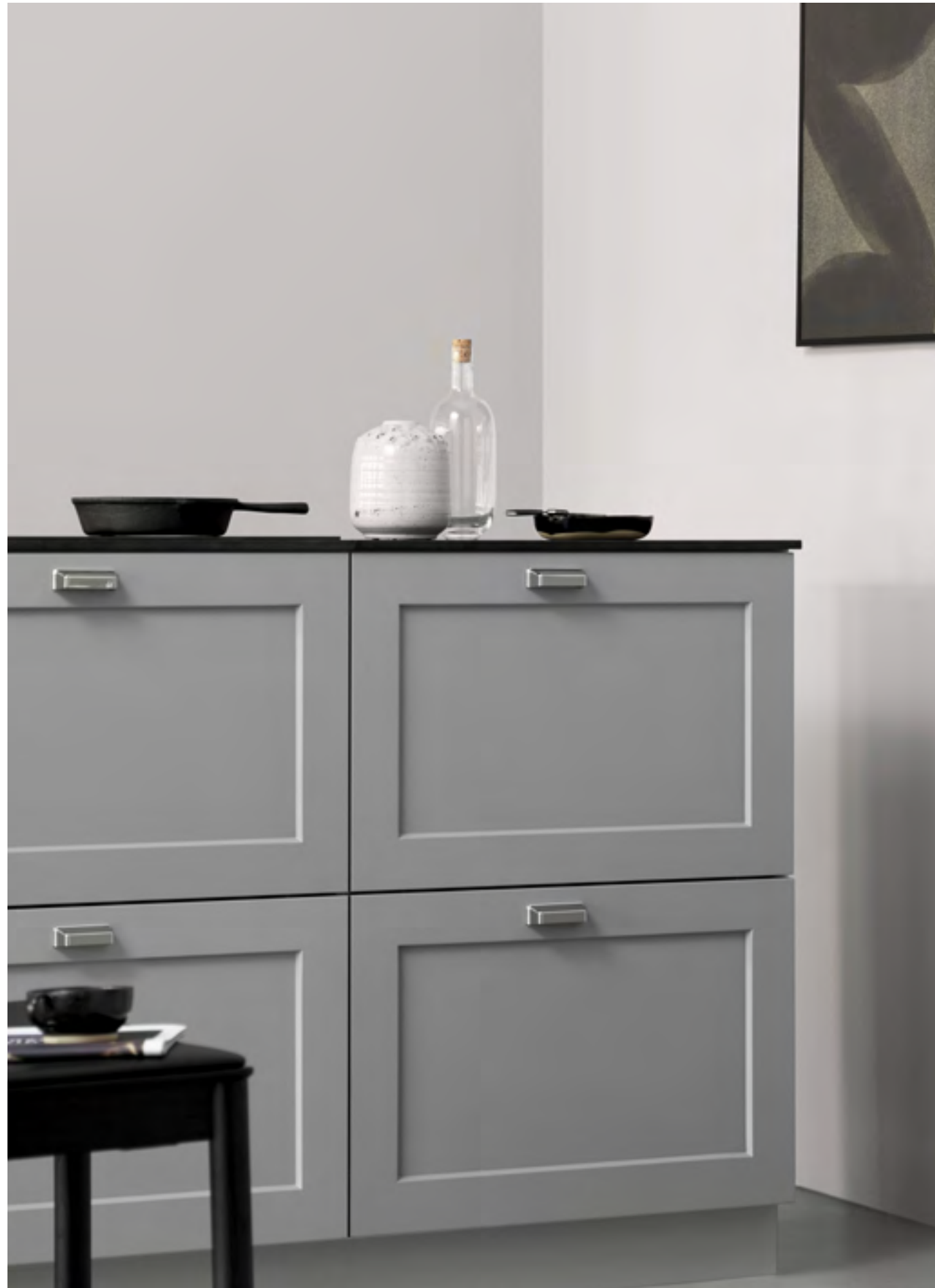
Equester Cup | Disegnata: Kamper Form | Indice: 90