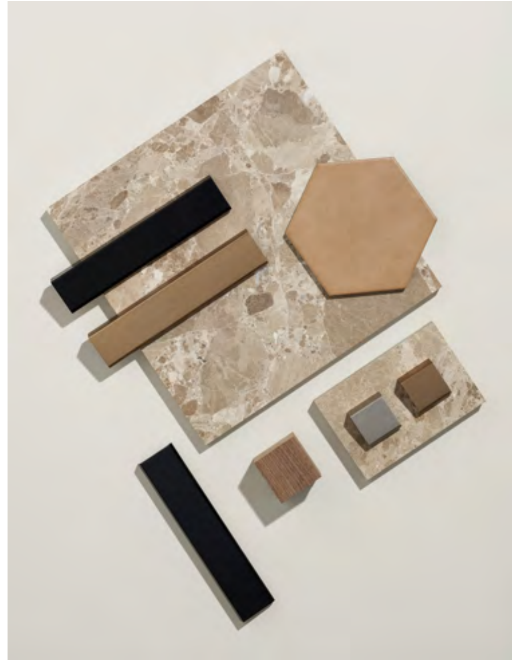
Artisan | Disegnata: VE2 | Indice: 88