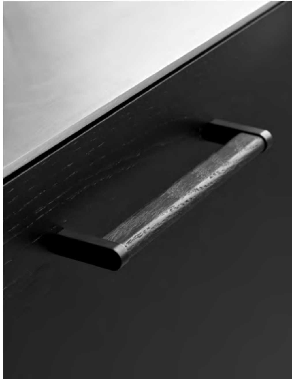
Crossing | Disegnata: kaschkasch | Indice: 89