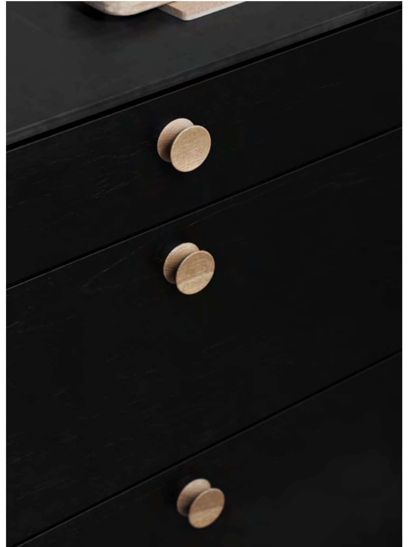
Pulley | Disegnata: kaschkasch | Indice: 92