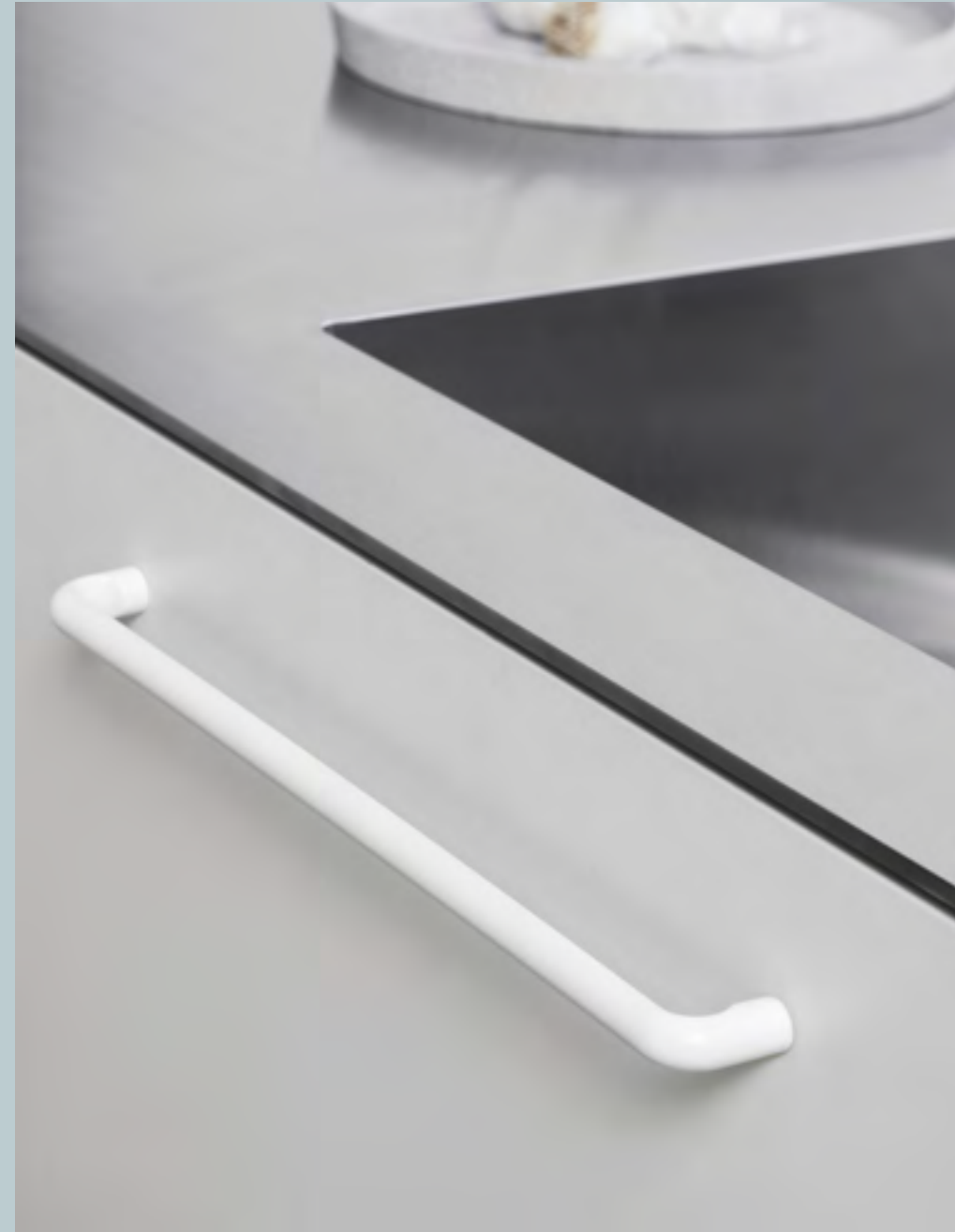
Carve | Disegnata: Kamper Form | Indice: 88