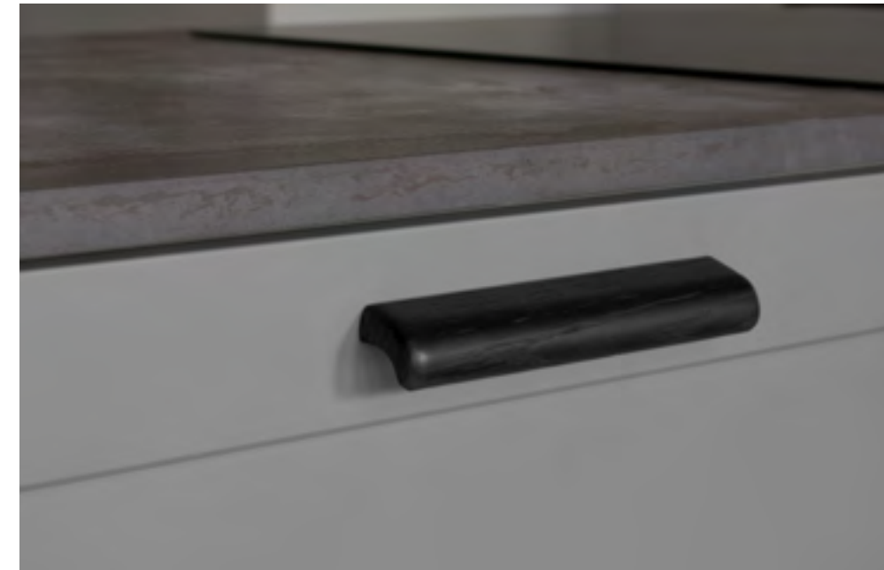
Glove | Disegnata: kaschkasch | Indice: 90