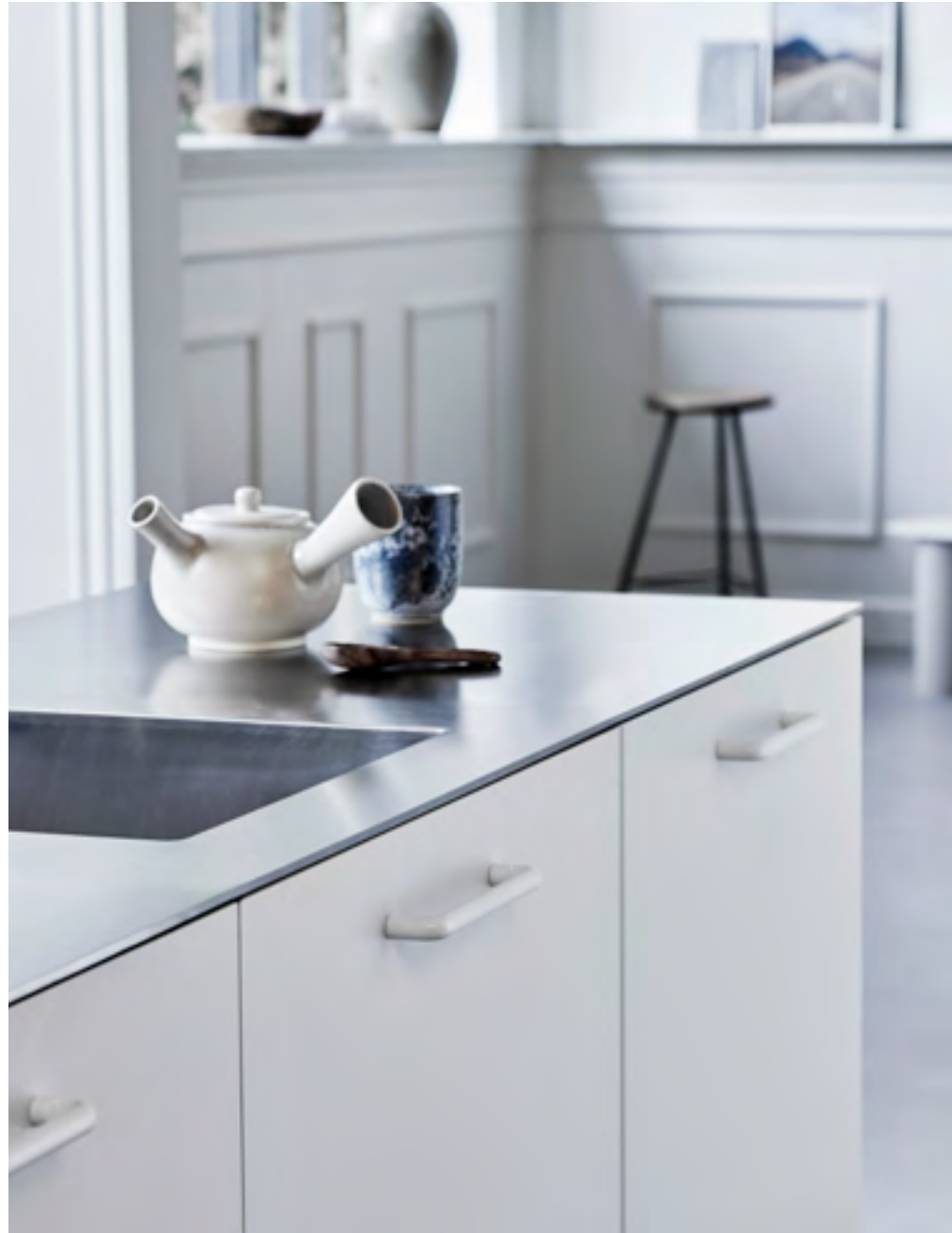
Carve | Disegnata: Kamper Form | Indice: 88