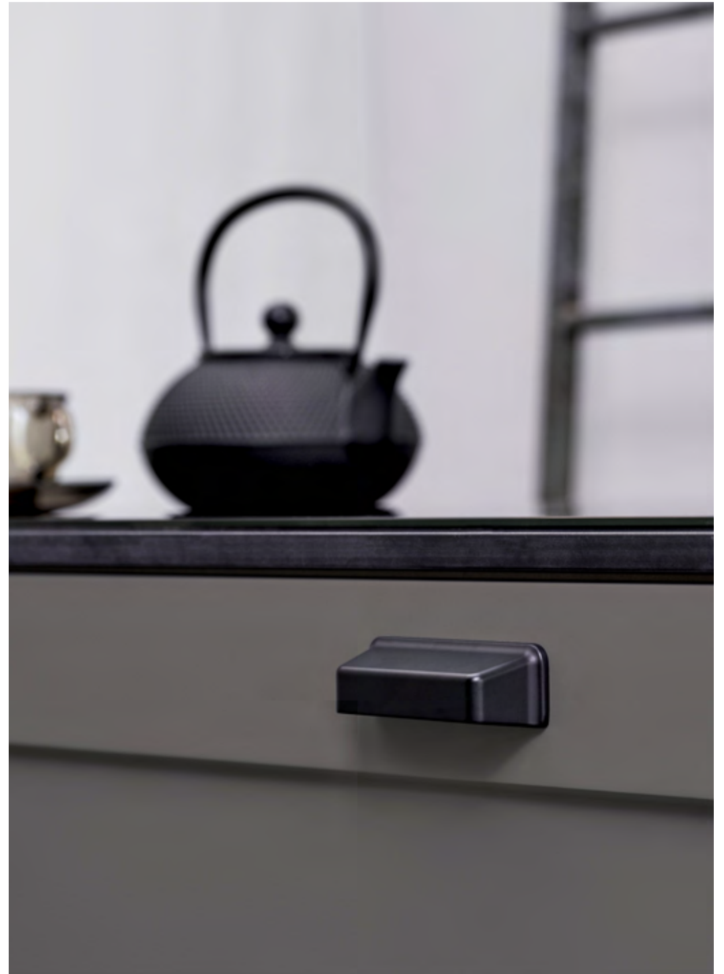
Equester Cup | Disegnata: Kamper Form | Indice: 90