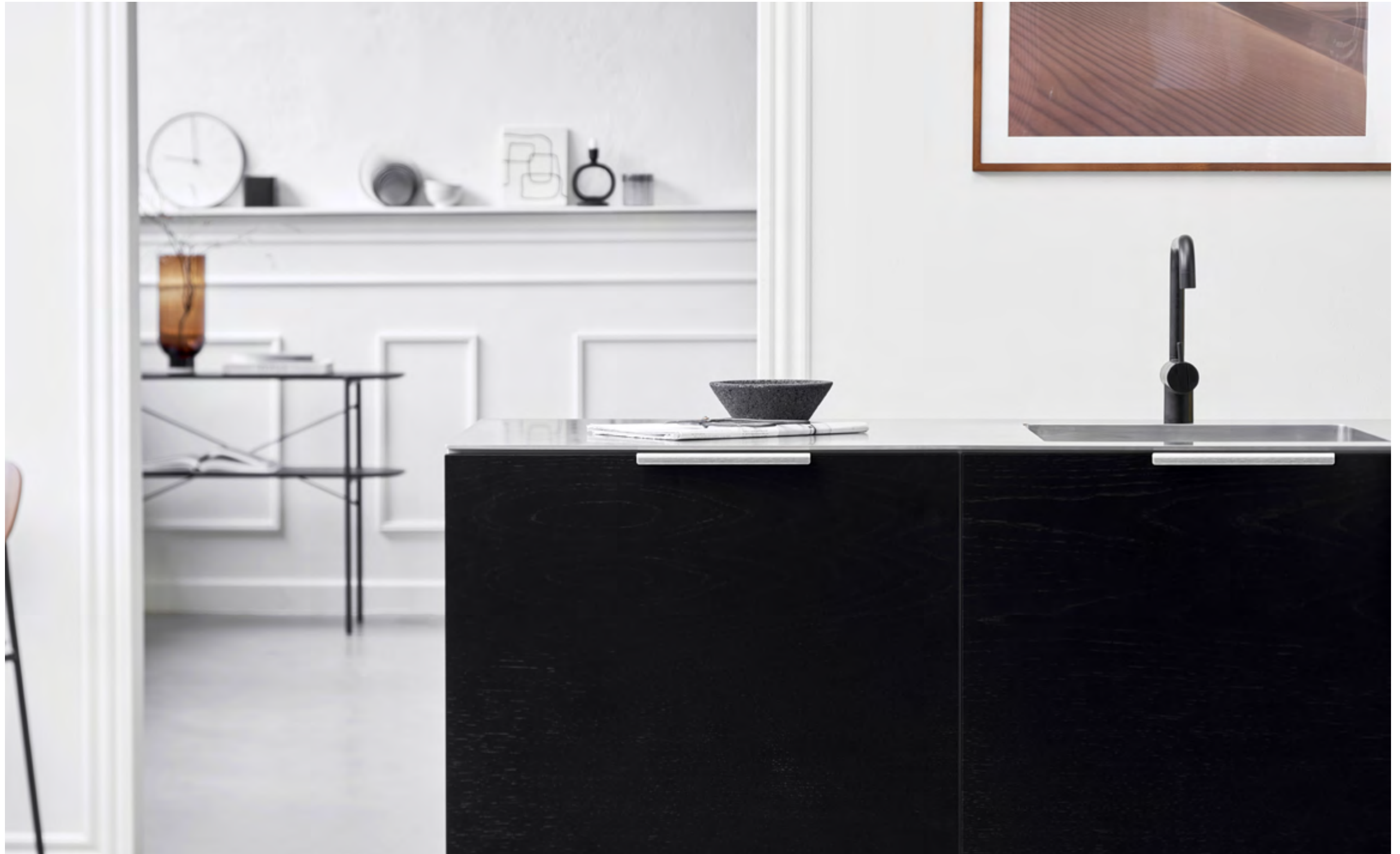
Artisan | Disegnata: VE2 | Indice: 88