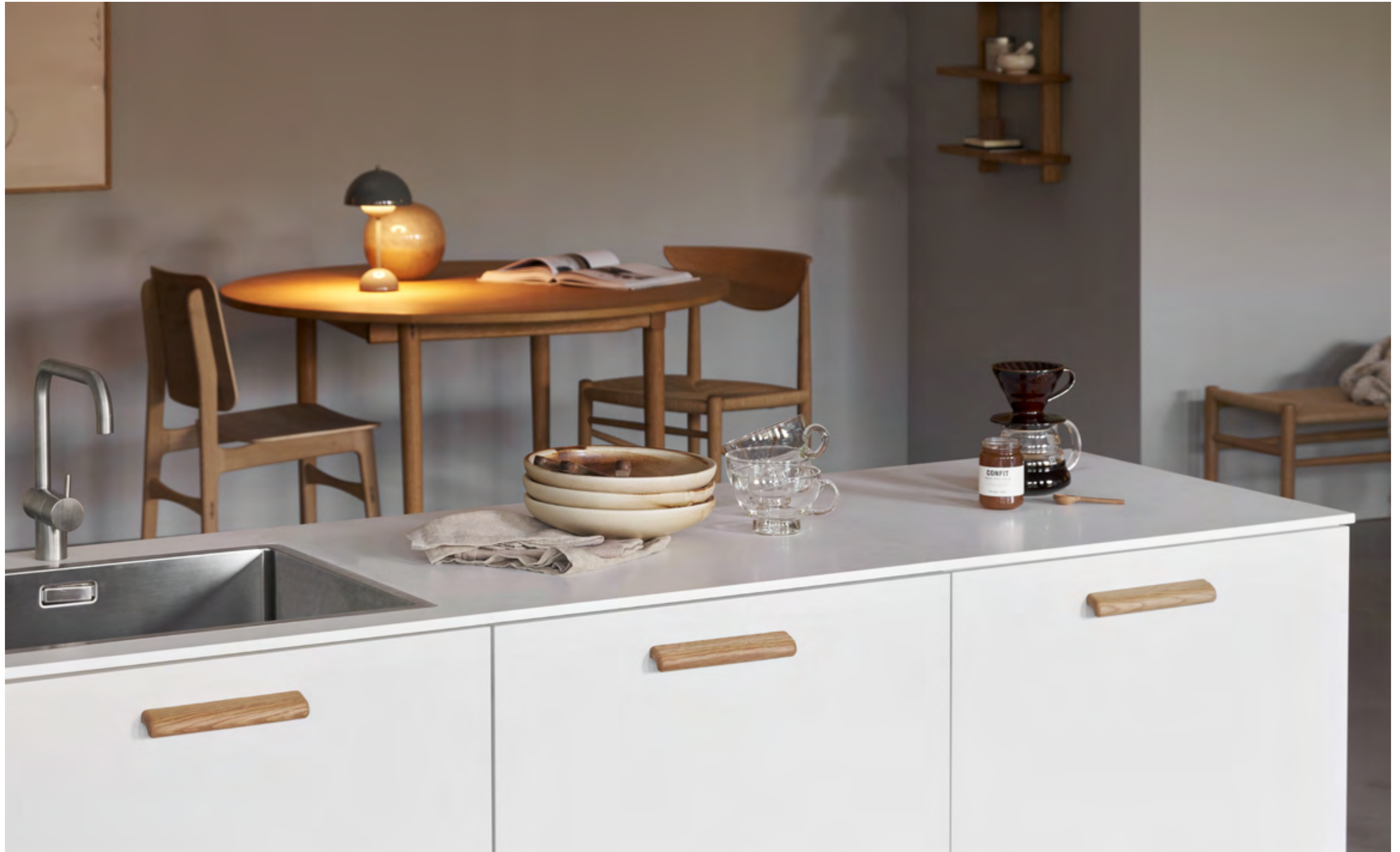
Glove | Disegnata: kaschkasch | Indice: 90