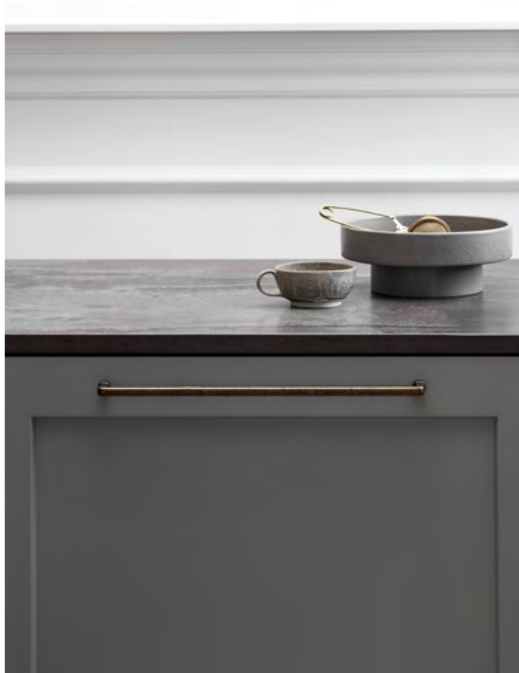
Equester | Disegnata: Kamper Form | Indice: 90