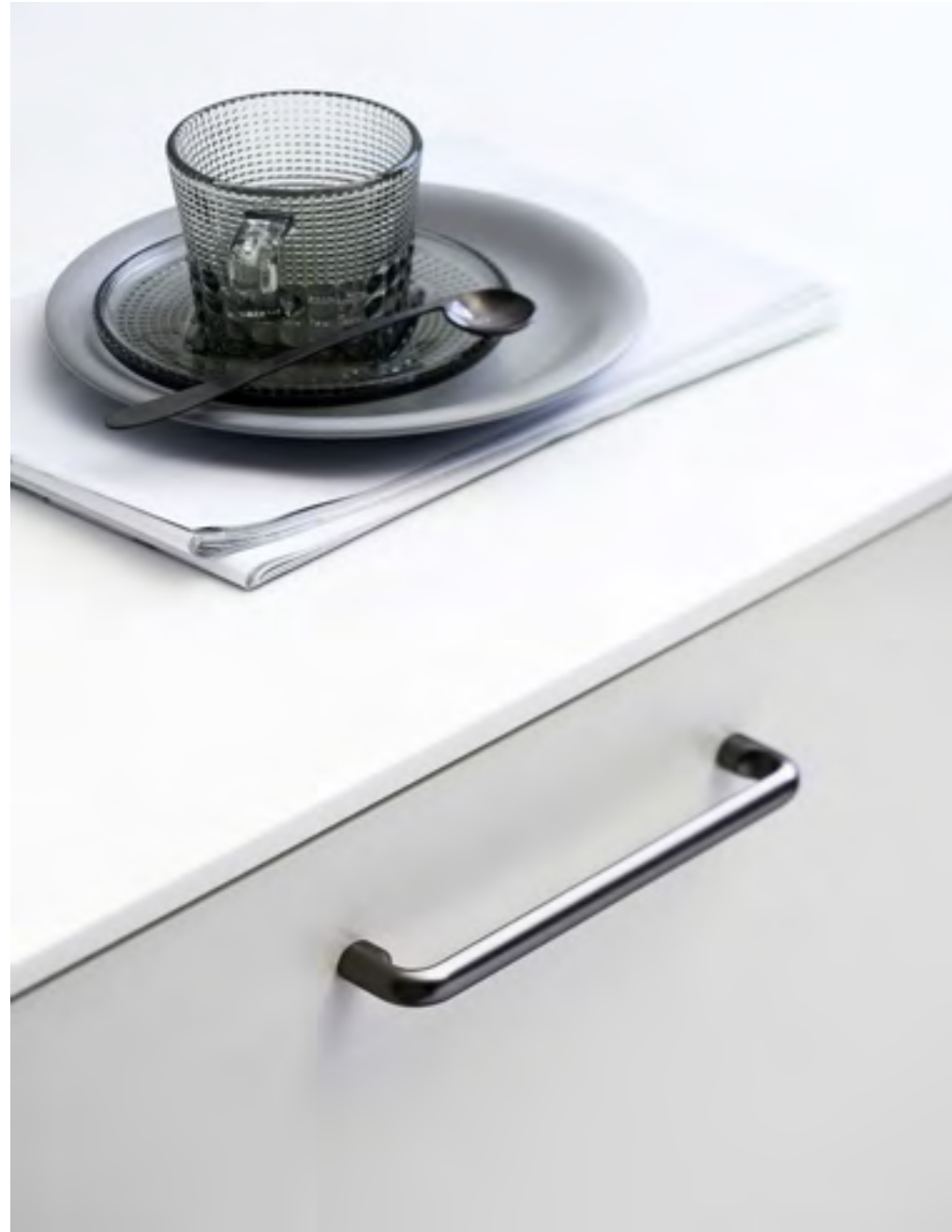
Carve | Disegnata: Kamper Form | Indice: 88