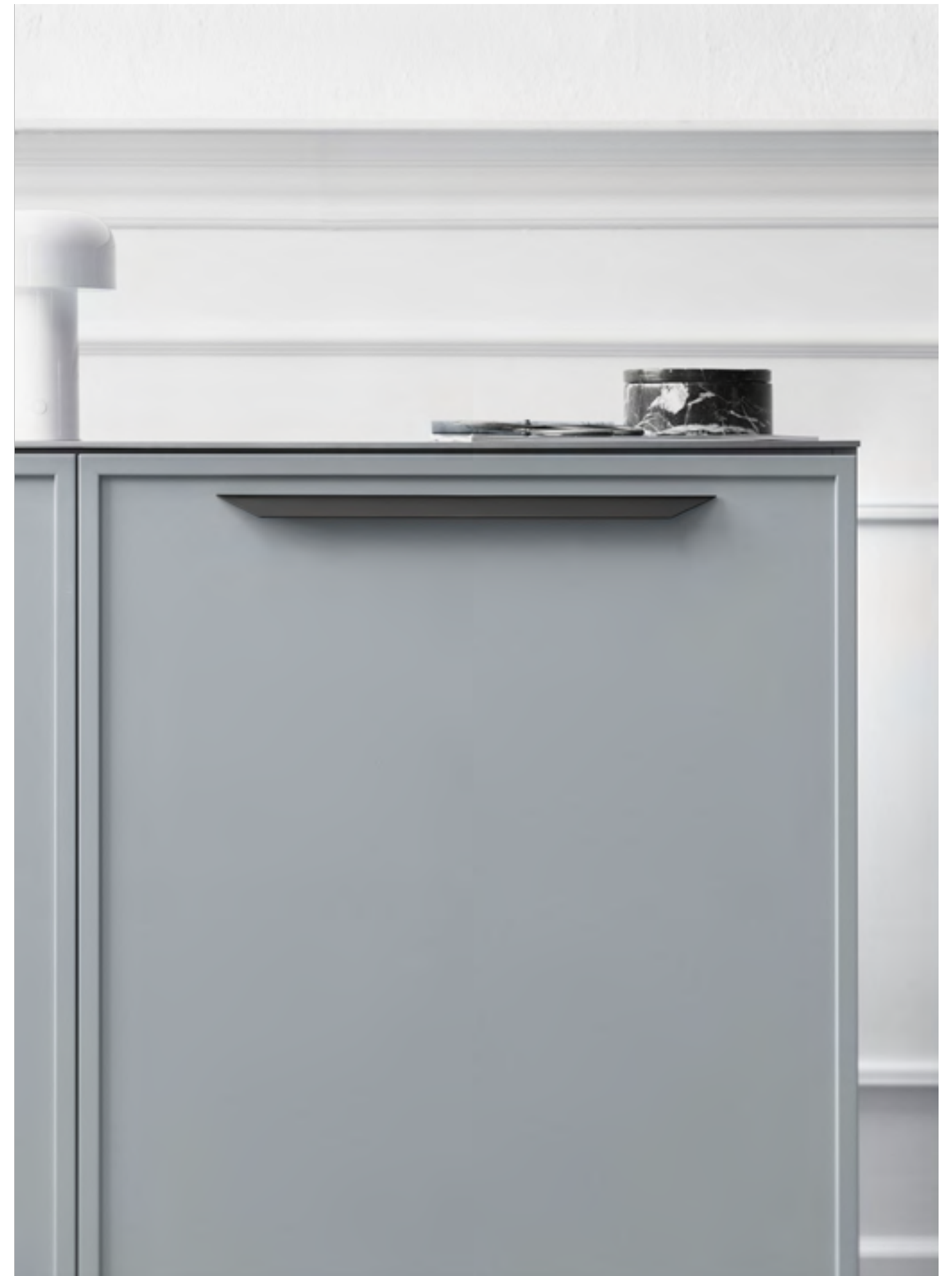
Streamline | Disegnata: Adam Laws | Indice: 92