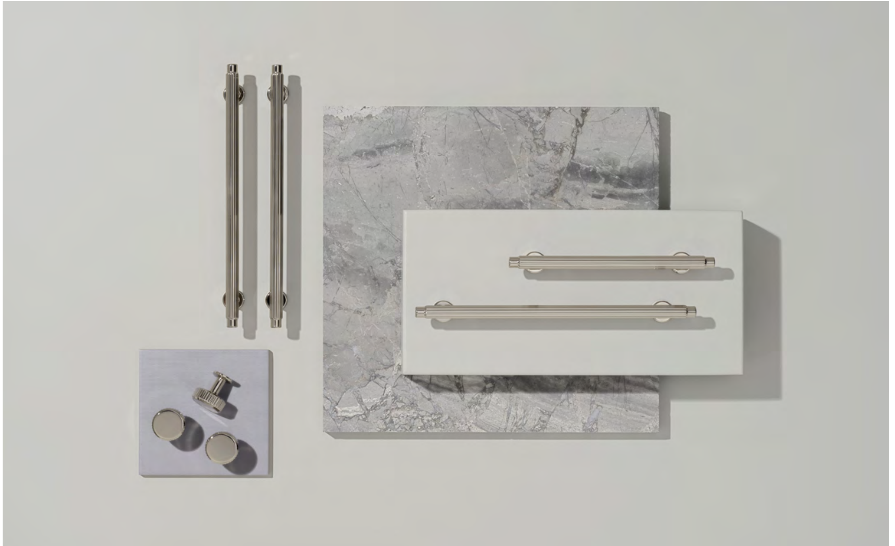
Villa & Villa Round | Disegnata: Kamper Form | Indice: 93