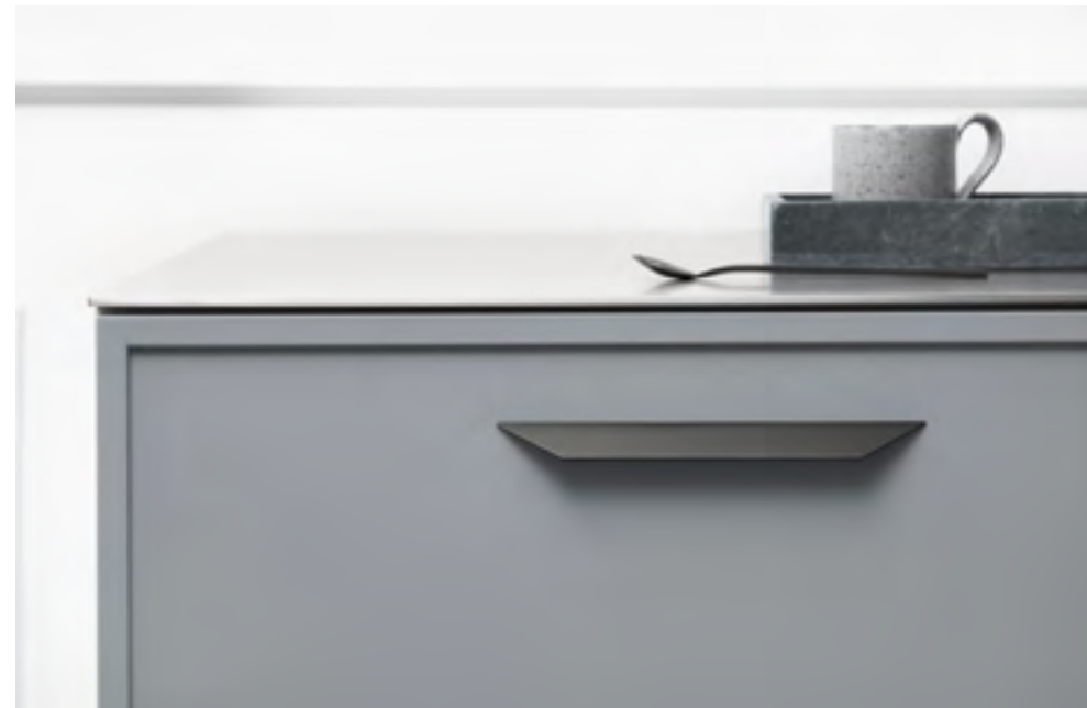
Streamline | Disegnata: Adam Laws | Indice: 92