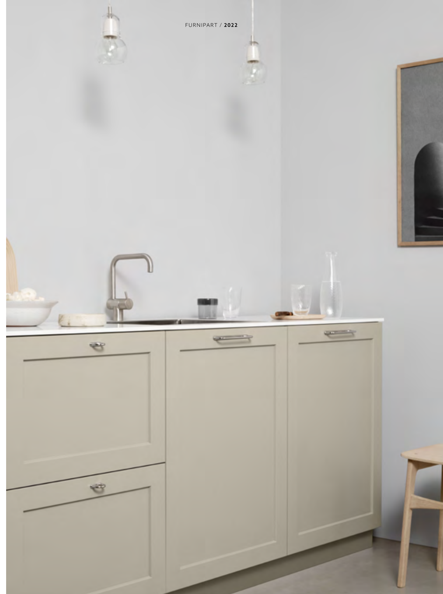
D-lite | Disegnata: Adam Laws | Indice: 89