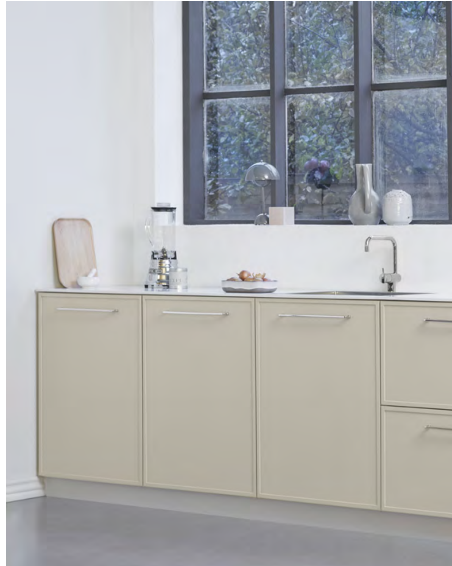
Equester | Disegnata: Kamper Form | Indice: 90

I piedini e la base sia di Equester che di Equester Cup presentano una forma che ricorda la testa dei chiodi usati per ferrare i cavalli: un piccolo dettaglio che ne sottolinea in ogni caso il design. La famiglia Equester ha la giusta misura di ornamenti senza essere troppo elaborata.