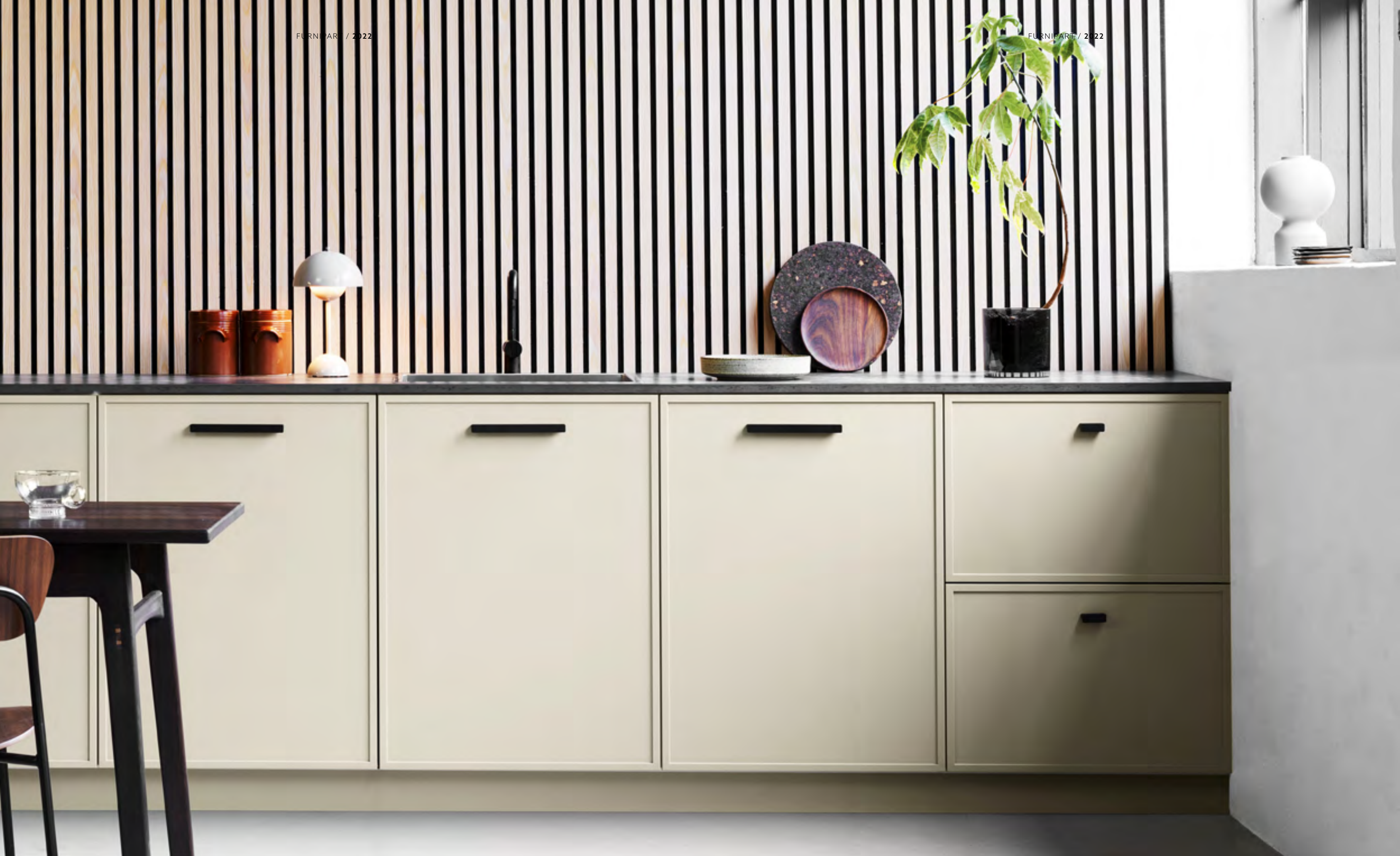
Elan | Disegnata: VE2 | Indice: 89