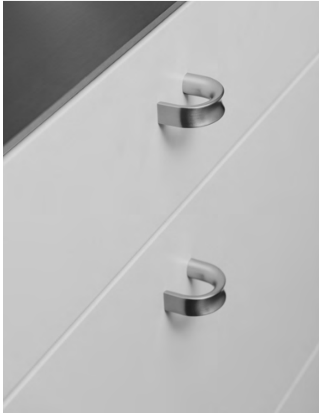
Inside | Disegnata: kaschkasch | Indice: 91