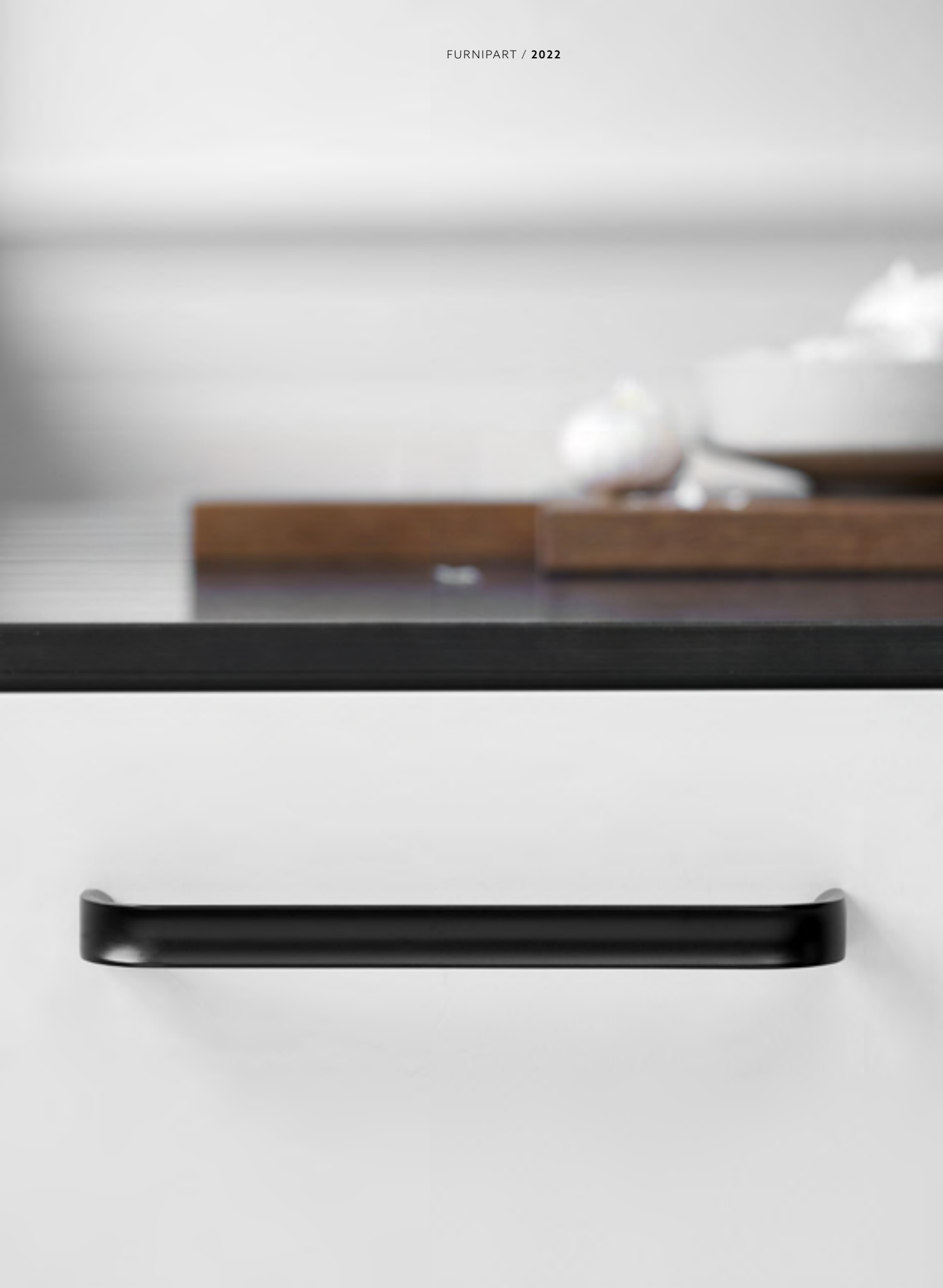
Inside | Disegnata: kaschkasch | Indice: 91