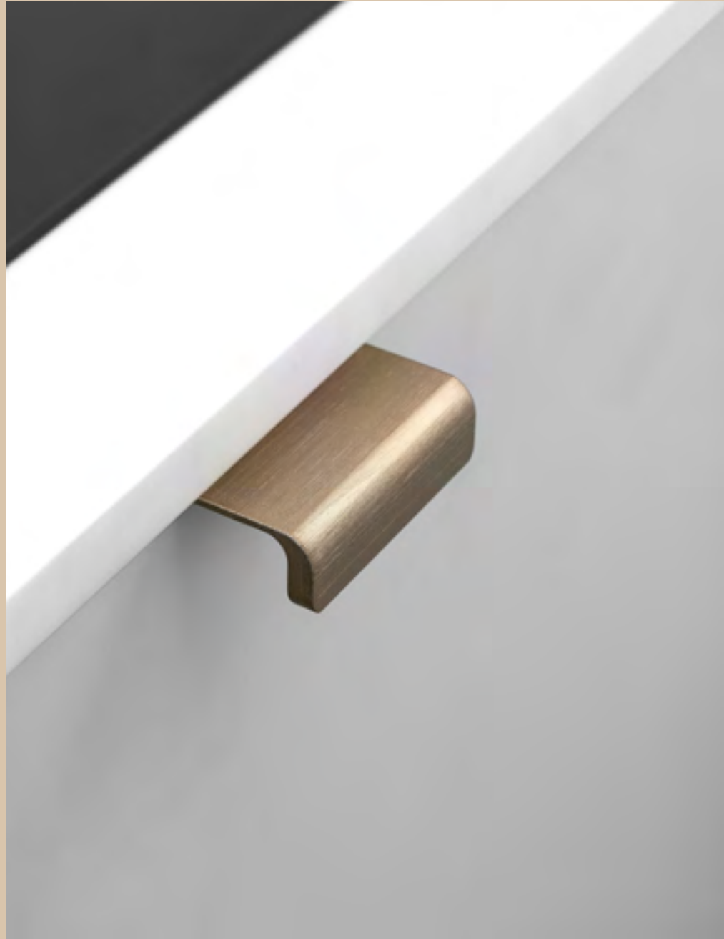
Artisan | Disegnata: VE2 | Indice: 88