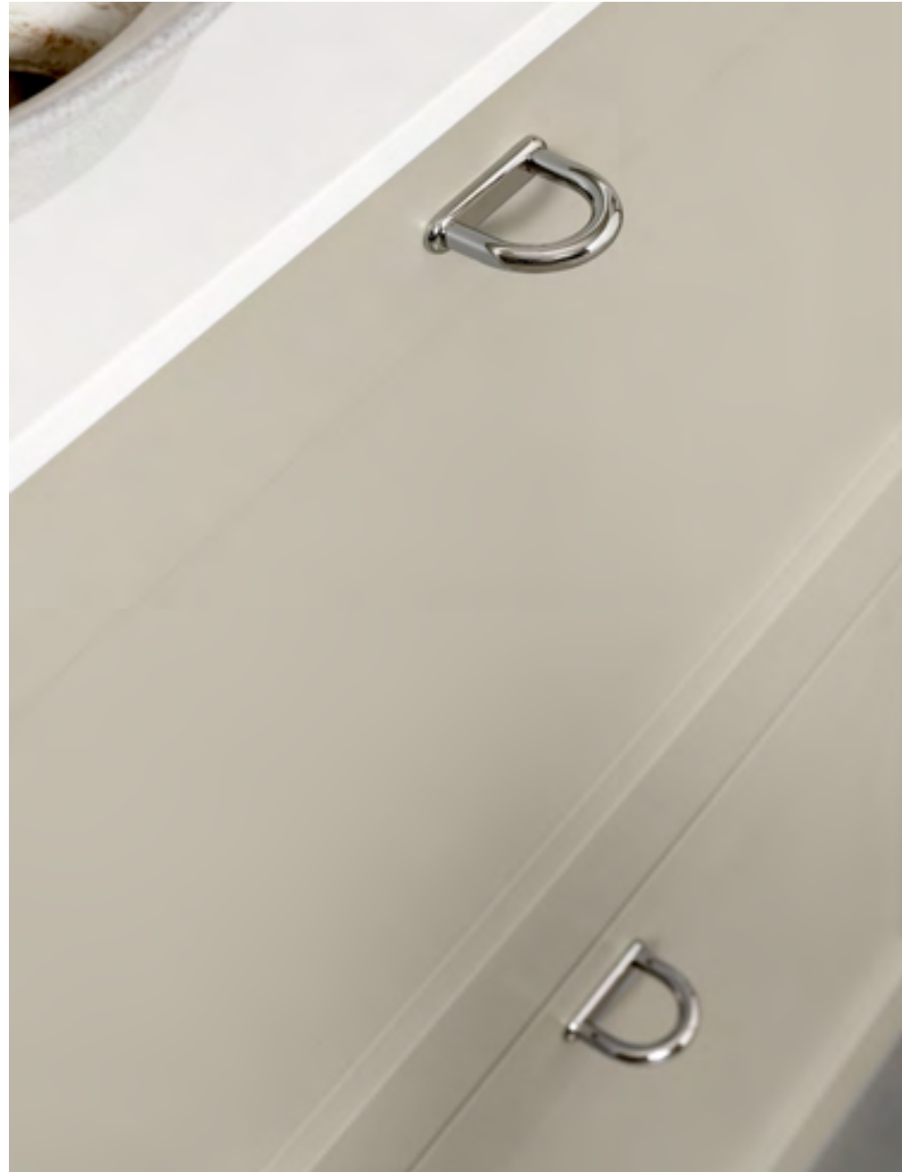
D-lite | Disegnata: Adam Laws | Indice: 89