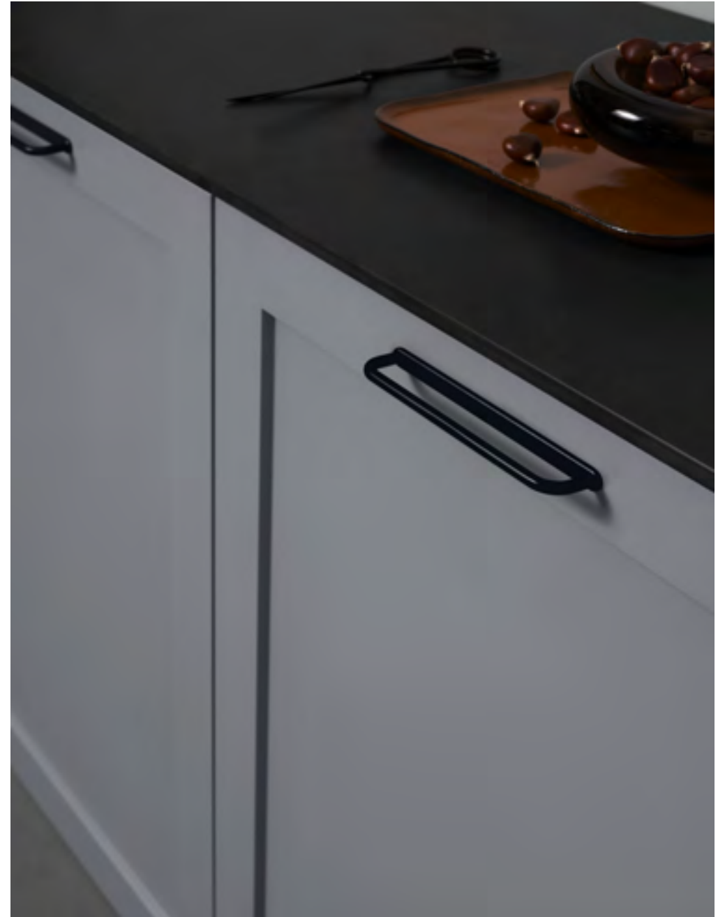
D-lite | Disegnata: Adam Laws | Indice: 89